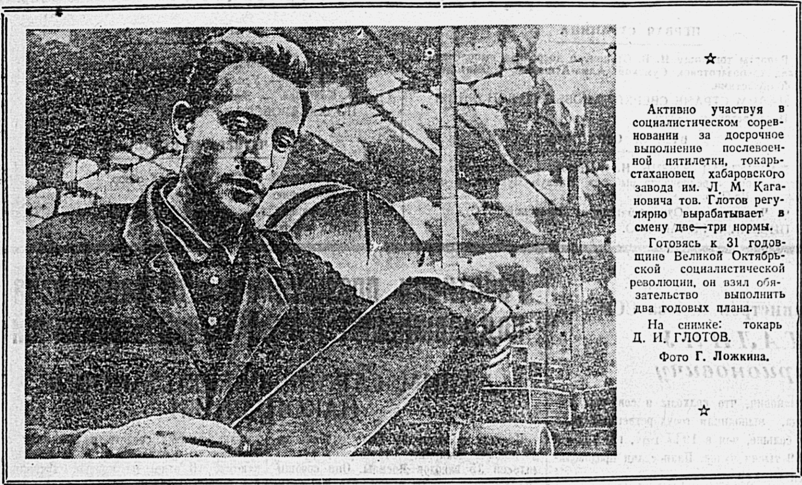
Активно участвуя в социалистическом соревновании за досрочное выполнение...