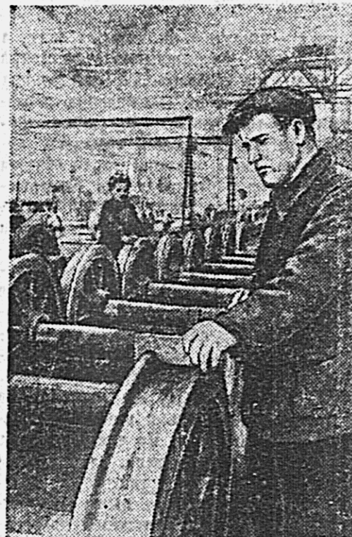
Коллектив Липовозовского вагоностроительного завода обязался завершить годовую план к 20 октября. Вагоностроители успешно выполняют свои повышенные обязательства.

Среди найденных документов — рукописная листовка нижегородского комитета РСДРП «Обращение к крестьянам», два экземпляра 10-го номера журнала «Юный рабочий» и брошюра «Рабочие и революция», напечатанные в Женеве в 1902 году.