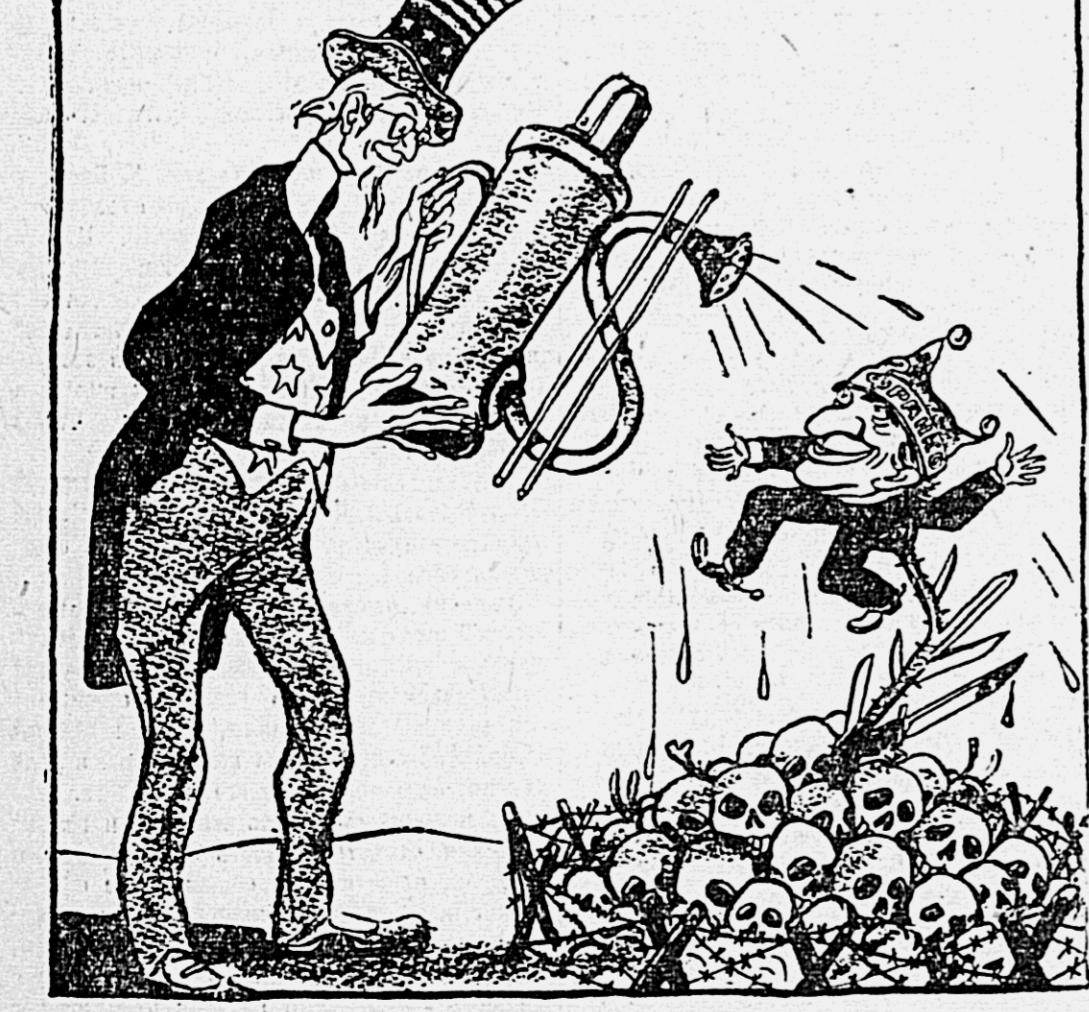
Испанский «цветок» и американский садовник