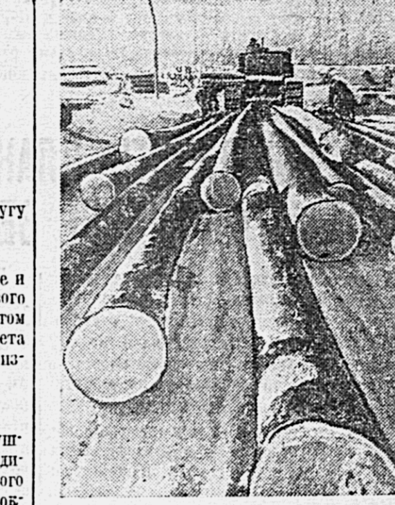
На снимке: трелевка леса на склад Обороном лесхоза.

Да здравствует вечная дружба наших народов!