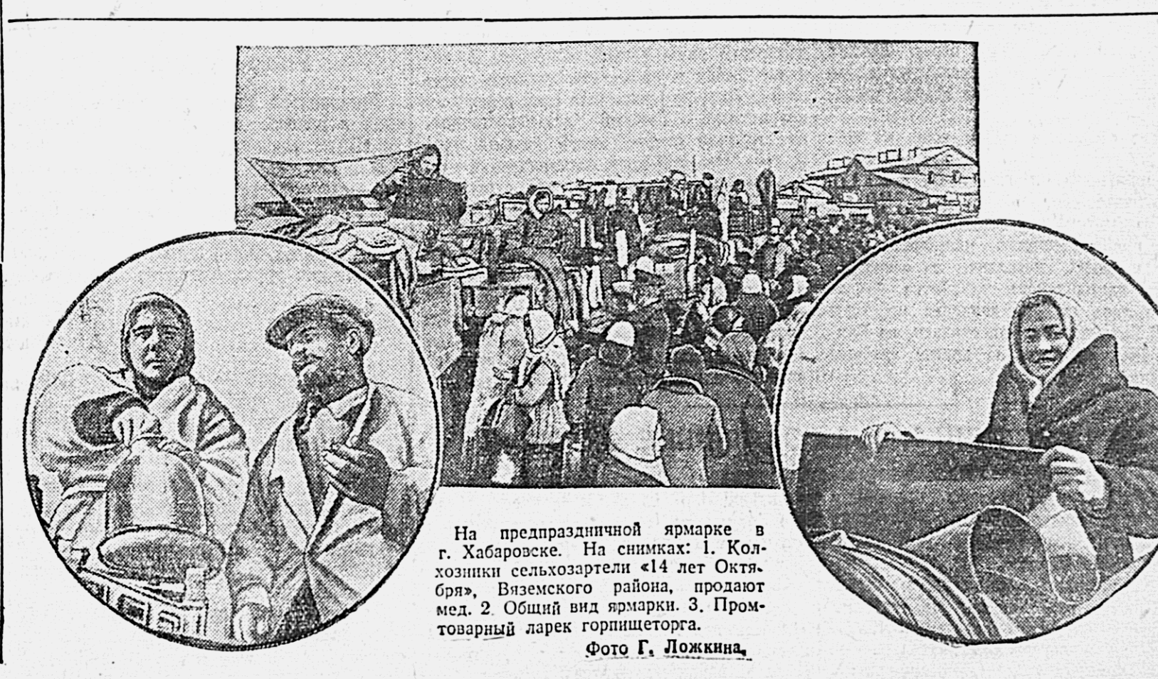
На предпраздничной ярмарке в г. Хабаровске. На снимках: 1. Колхозники сельхозартели «14 лет Октября», Вяземского района, продают мед. 2. Общий вид ярмарки. 3. Промышленный ларек горнинторга.