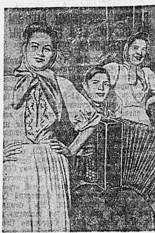
Коллектив художественной самодеятельности судостроительного завода в г. Советская Гавань готовится к празднику.

«ДЕНЕГ ИЗРАСХОДОВАНО МНОГО, А СДЕЛАНО МАЛО» Под таким заголовком в «Тихоокеанской звезде» был помещен материал районной бригады по проверке готовности районных объектов и квартир к зиме в поселе Хабаровского судостроительного завода.