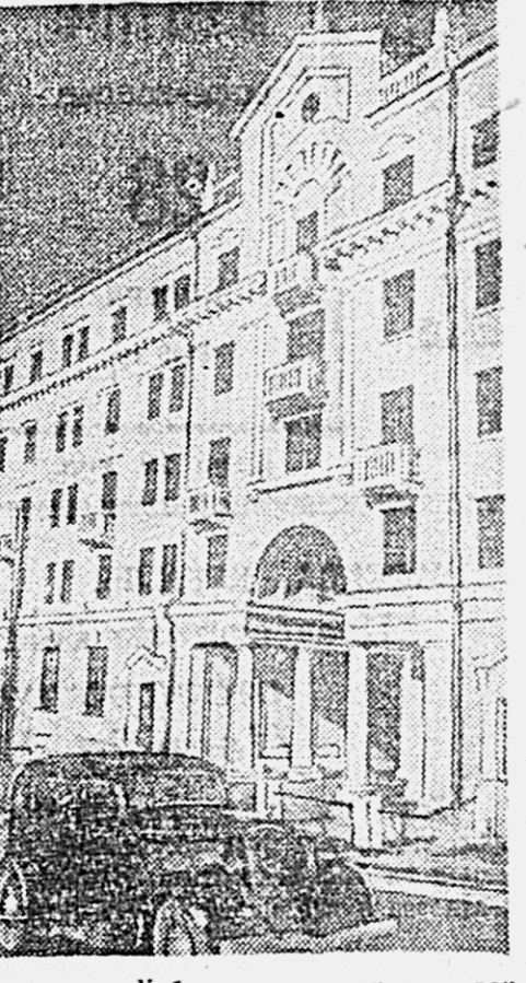
Недавно в Хабаровске закончено строительство новой гостиницы по ул. Волочаевской. На снимке: здание новой гостиницы.