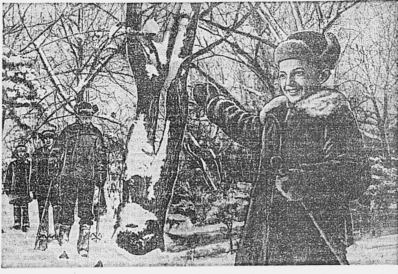
В этом году зима к нам пришла с созданием. Только недавно первый снег устала пушистым ковром окрестные сопки и поля, мягкими хлопьями поспе на летнее одеяло, чем дымка пролука на снимке: юные лыжники.