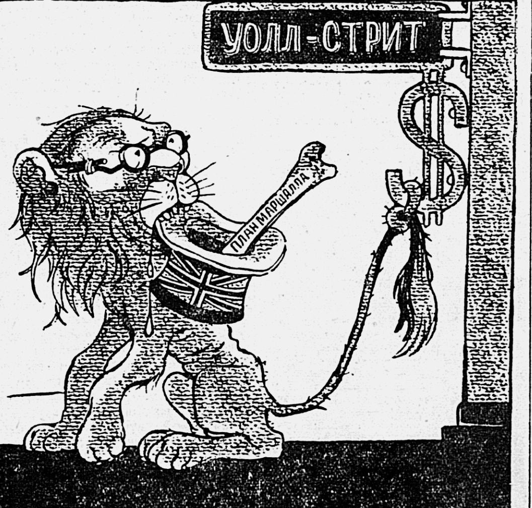
БРИТАНСКИЙ ЛЕВ НА ПРИВЯЗИ

РИМ, 31 января. (ТАСС). Высшая итальянская литературная премия «Визенджо» 1947 года присуждена основателю итальянской коммунистической партии Антонио Грамши за его книгу «Письма из тюрьмы», вышедшую в прошлом году. В книге собраны письма, которые Грамши писал к родным в период с 1926—1937 г.г. из фашистского застенка, где он был замучен палачами Муссолини. 29 января состоялось торжественное вручение премии сыновьям Грамши.