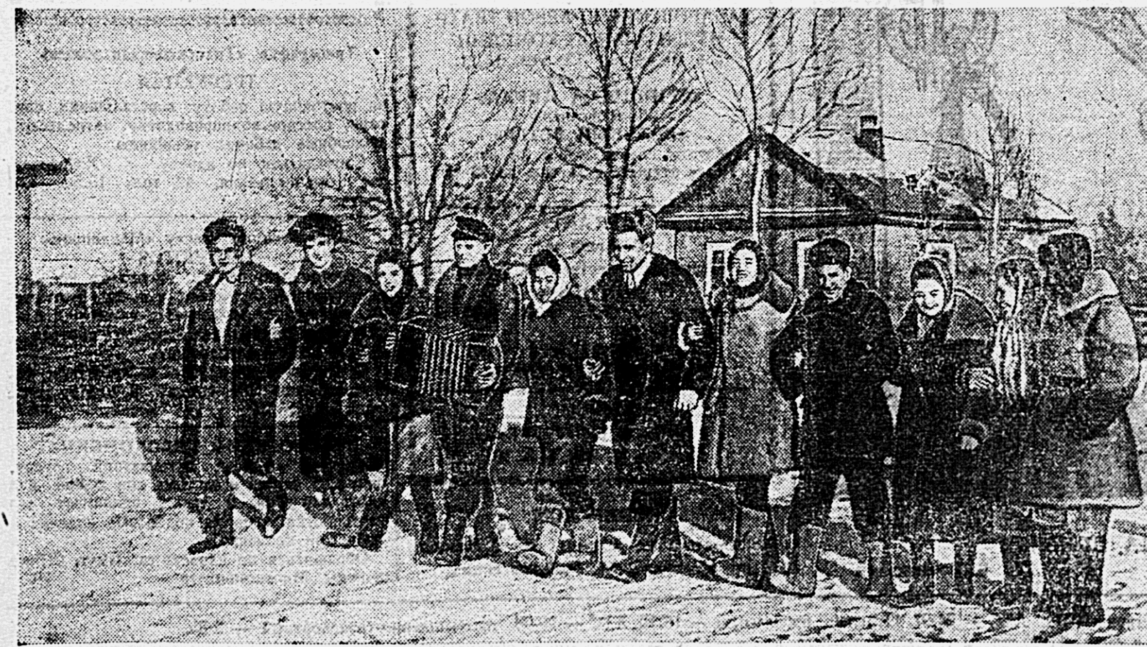
На снимке: группа молодых колхозников сельхозартели им. Кирова направляется на отчетное собрание.

ведома и согласия общего собрания были проданы швейной фабрике две тоины сои. Мало требуется аккуратности от счетово-дчика. Разница по лишним счетам про-водилась с опозданием на два — три мес-ца. Важные документы кладовщик держит в своем кармане по два — три месяца. В очном записанном состоянии прото-кольное хозяйство. В книге протоколов зарегистрировано лишь 18 заседаний правления, а на самом деле их было 28. Такая же картина и с протоколами общих собраний. А это приводит к тому, что некоторые решения правления колхоза или общего собрания не выполняются. Все эти недостатки отмечены нами в ак-те ревизии, их нужно не допускать в 1948 году. Надо, чтобы Устав сельхозар-тели соблюдался со всей точностью, ибо это закон нашей жизни.