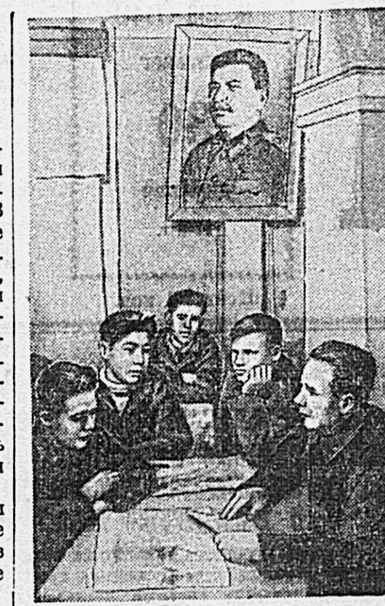
В красном уголке общешкольного кружка рабочих судостроительного завода в Комсомольске-на-Амуре регулярно проводятся беседы о выборах народных судов.

Важнейшим методом партийного просвещения является групповая работа. В каждой партийной организации должна быть создана атмосфера общественного обсуждения всех тем, что не жалеет повысить свой идейно-политический уровень.