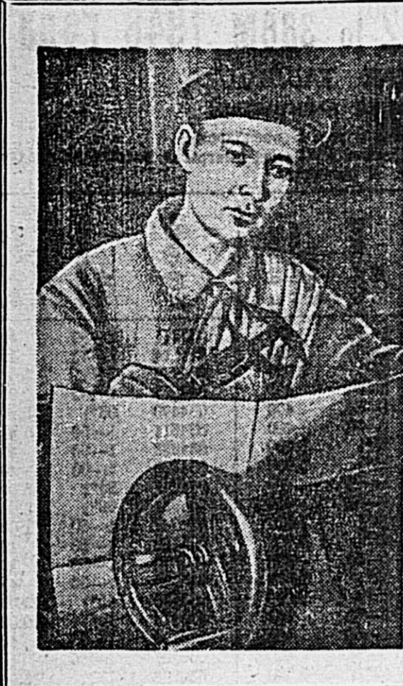
Многостановки промышленности... Многостановки промышленности встретили в декабре 1948 года досрочное выполнение своих производственных заданий.