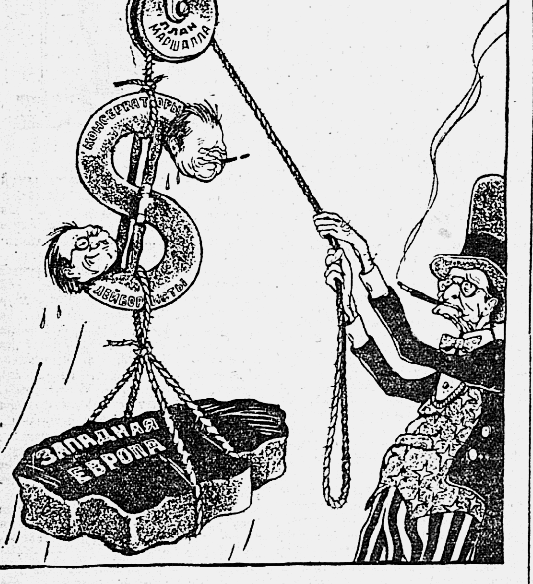
Наглядная схема «западного блока» Рис. В. Павинского.

Ответственный редактор Н. С. ИЛЬНИНСКИЙ.