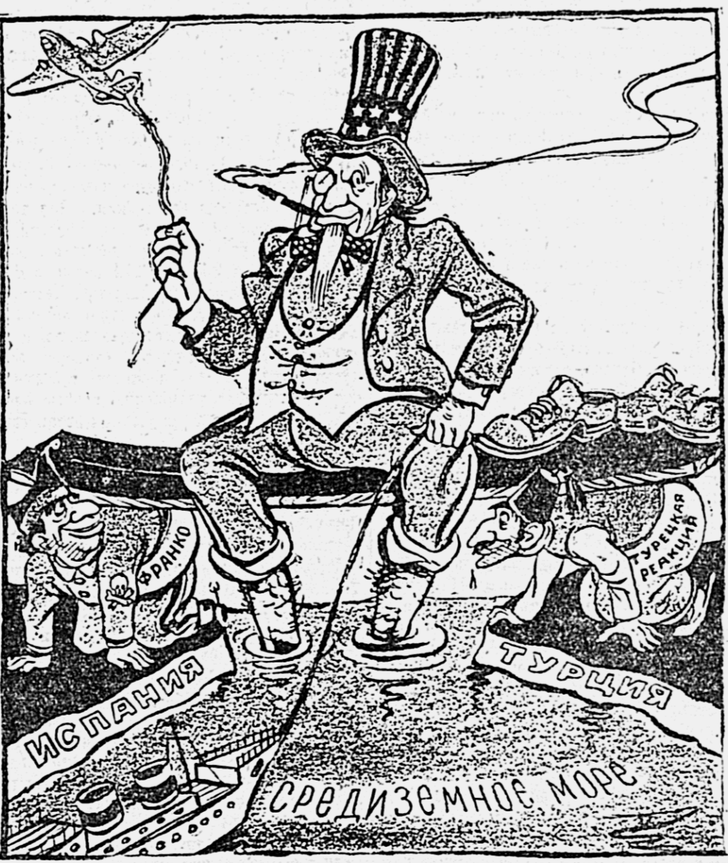
Заокеанский дядюшка мутит воду... Рис. В. Павчинского.