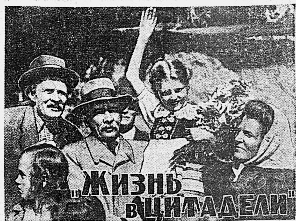
ЖИЗНЬ В ЦИТАДЕЛИ

В маленьком эстонском городке ждут прихода Советской Армии. Все слышнее грохот артиллерийских канонад, все громче шум боя. Ближние разлитый дым освобождаемого эстонского народа от немецко-фашистских захватчиков.