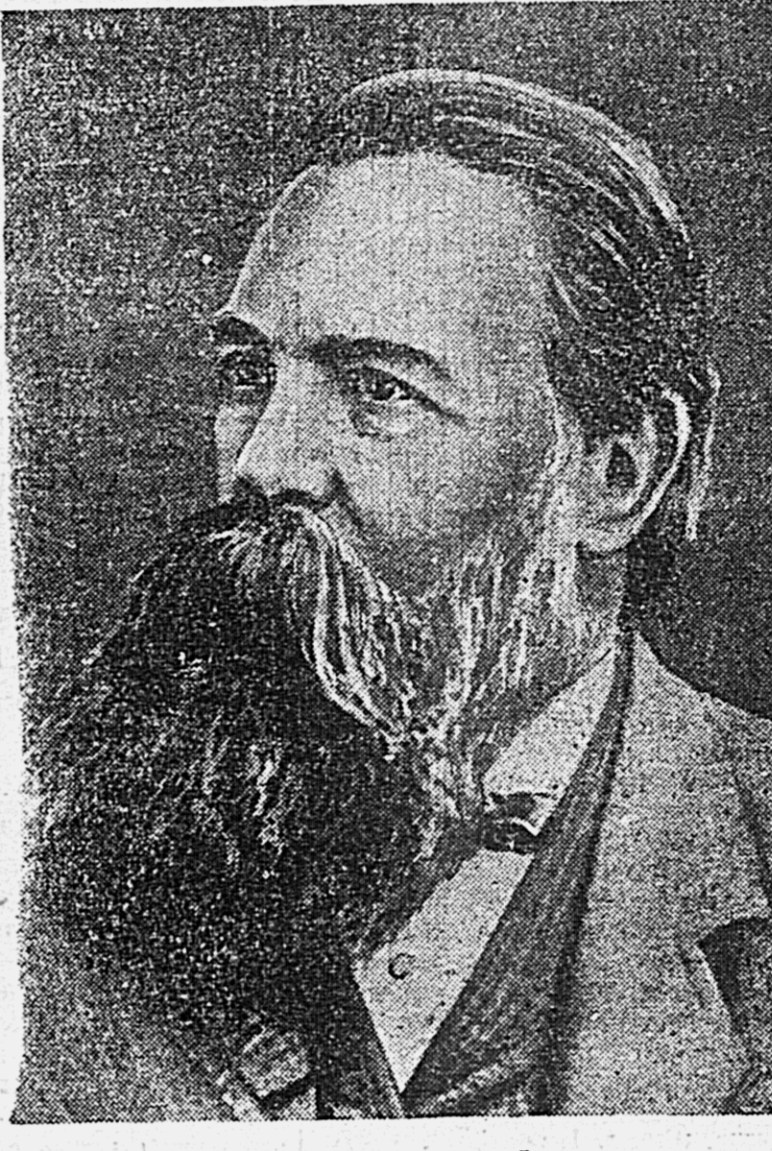
Основоположники научного коммунизма, творцы «Манифеста Коммунистической партии» КАРЛ МАРКС И ФРИДРИХ ЭНГЕЛЬС.