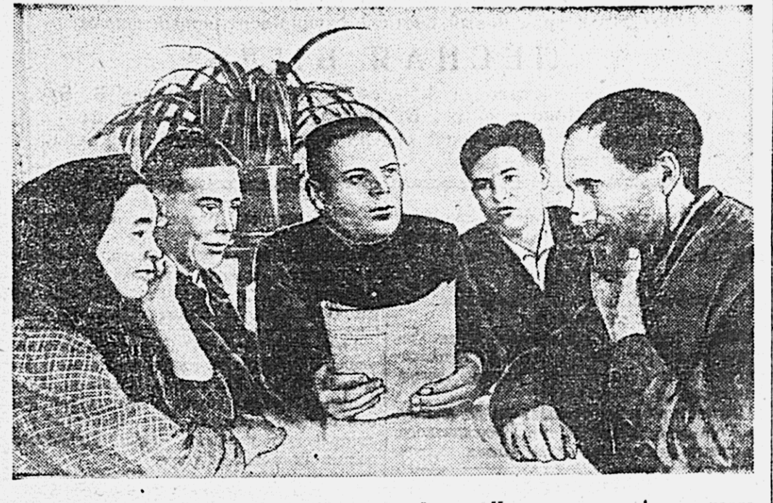
Агитпункт поселка Победа Ленинского района в Комсомольске-на-Амуре, после выборов в Верховный Совет СССР продолжает проводить агитмассовую работу среди населения.

Сталинский район партии гор. Хабаровска провел семинар редакторов и членов редколлегии стеновых газет.