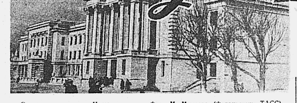
Одна из улиц города Читы.

Рыбаки колхозов «Комсомолец» и им. Ленина, Комсомольского района добывают часть на озере Эворон.