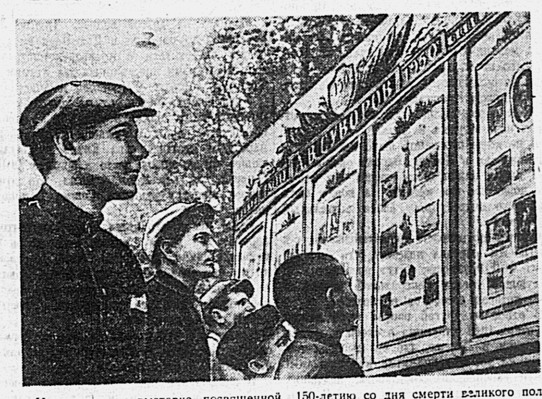
На снимке: на выставке, посвященной 150-летию со дня смерти великого полководца А. В. Суворова в Хабаровском парке культуры и отдыха.

ПАЛАНА-НА-КАМЧАТКЕ, 18 мая. (КрайТАСС). В нынешнем году исполняется 20-летие Корякского национального округа. Знаменательную дату трудящиеся округа решили встретить новыми достижениями. На предприятиях рыбной промышленности, в колхозах развертывается социалистическое соревнование в честь праздника. Инспекторы выступили колхозники артели «Тумгутум», Караганского района. Они обязались выполнить годовое задание за шесть месяцев и дать сверх плана шесть тысяч пудов рыбы. Поддерживая почин передовых колхозников, рыбаки артели «Путь Севера», Ленжинского района, также включились в соревнование в честь юбилея. Они дали слово выловить сверх плана 1,600 пудов рыбы. В счет выполнения этого обязательства уже сланы первые десятки центнеров рыбы. В соревновании включились коллективы Караганского рыбокомбината, рабочие артели «Дальневосточник» и другие.