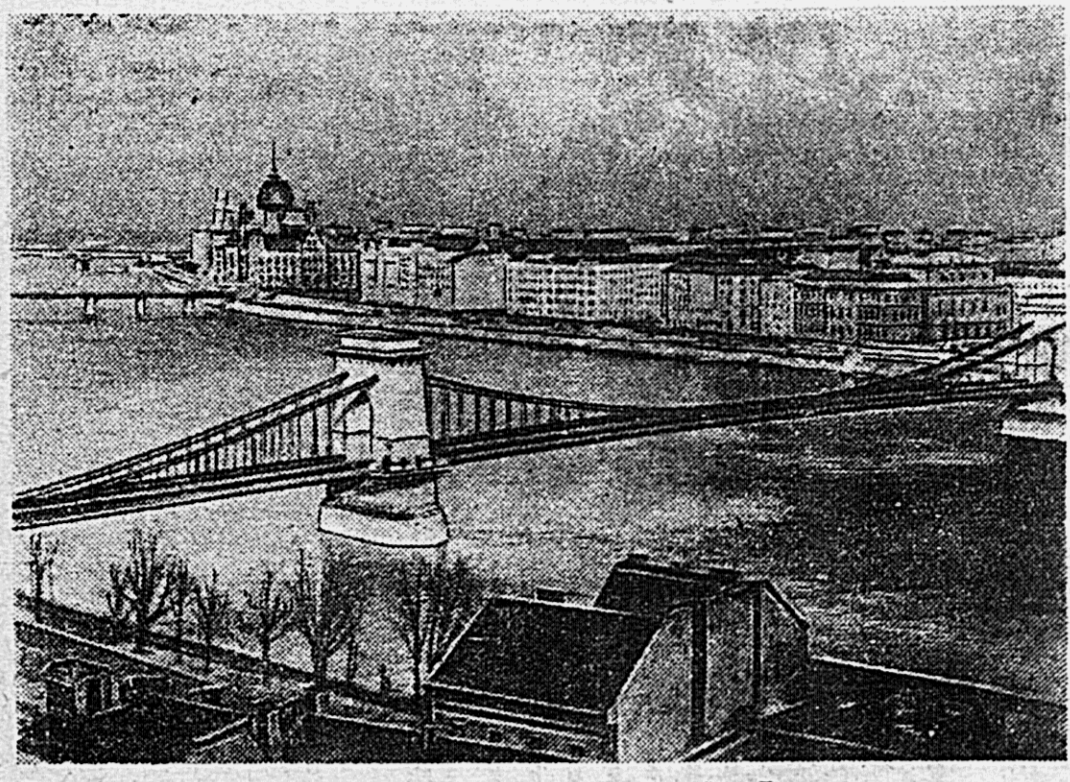
Венгрия. Восстановленный цепной мост через Дунай в Будапеште.