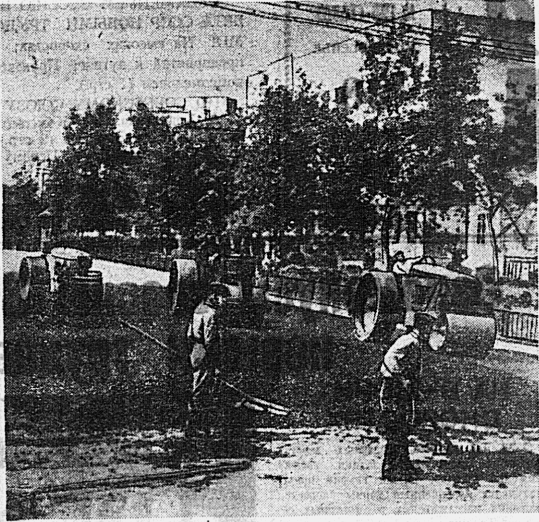
В Хабаровске ведутся большие работы по благоустройству города. Асфальтируют и озеленяют улицы, в ближайшее время закончатся строительные работы на лестнице К. Амура. На снимке: асфальтирование центральной улицы — имени Карла Маркса.