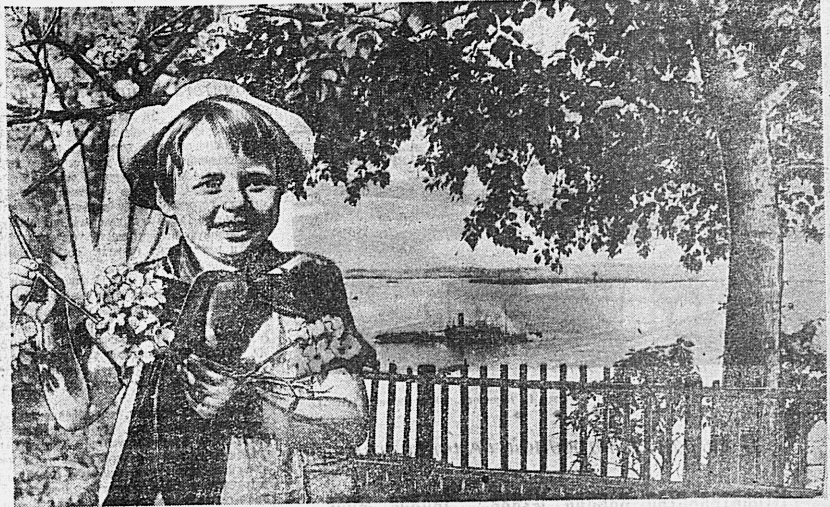
Неспешными теплыми днями. Как хорошо поблизать на Амуре, где яркое солнце светит над прозрачной водой, в парке культуры и отдыха, где в белом цветенье оделись черемуха и яблоня.

* Скрик каюра — погонщика со бачьей упряжки.