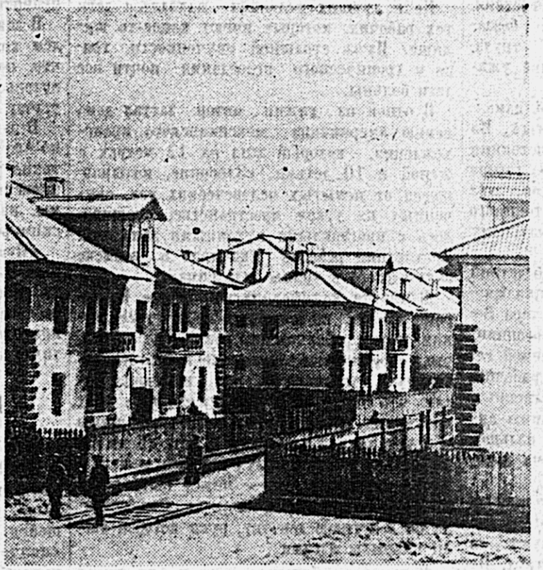
Новый рабочий поселок Хабаровского губернского завода.

Пока детскую площадку отделен неплохой угодок. Этим и ограничили руководители парка свою заботу о детях. Кроме нескольких картин и песочницы, на площадке