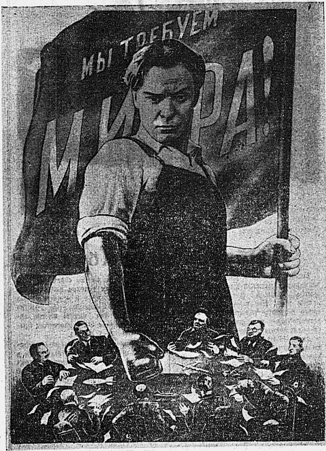
Плакат работы художника В. Корепного, выпускаемый государственным издательством «Искусство».

Во время пребывания правительственной делегации Германской демократической республики в Польше был сделан большой шаг вперед в области укрепления экономических отношений между обеими странами и было подписано соглашение о торговле и платежах на 1950 год, которое обеспечивает увеличение объема торговли более чем на 60 проц по сравнению с прошлым годом. Кроме того, подписано соглашение о предоставлении Польше кредитов Германской демократической республики. Было заключено также соглашение о техническом и научном сотрудничестве, которое обеспечит взаимное использование опыта методов производства, а также взаимное предоставление технической помощи.