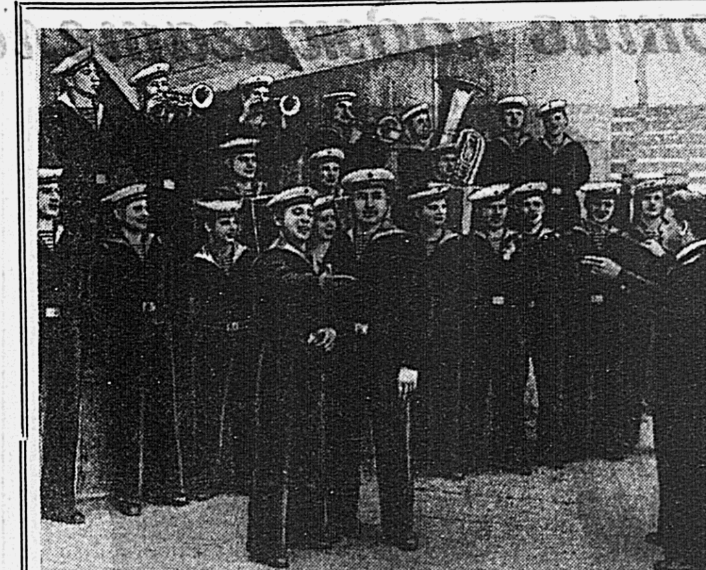
На снимке: выступление ансамбля песни и пляски Краснознаменной Амурской флотилии.