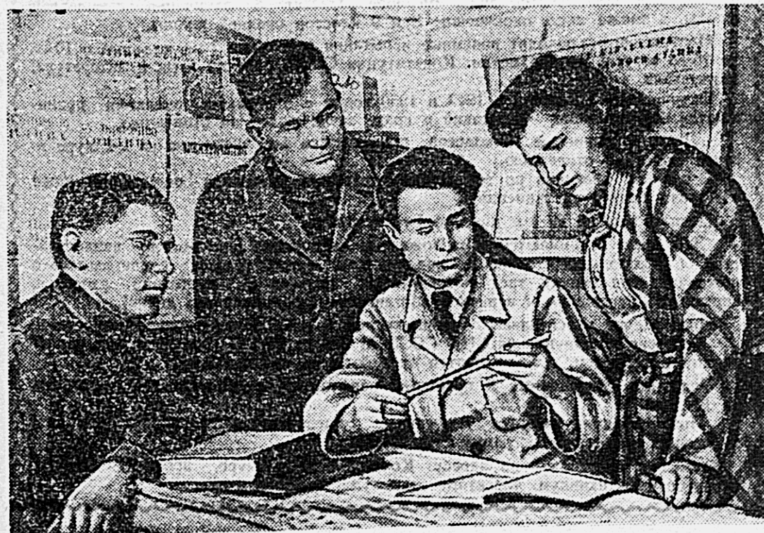
Коллективом завода им. Кагановича подвечен патристический почин Московского инструментального завода за превращение завода в предприятие сплошной технической грамотности. Сейчас здесь учатся большинство рабочих. Сотни из них уже получили удостоверение о повышении технической квалификации.

В Хабаровском парке культуры и отдыха созданы команды волейболистов и баскетболистов на члена посетителя парка. Уже созданы несколько тренировочных игр. В ближайшее время администрация предлагает провести соревнования по волейболу и баскетболу с целью выявления сильнейшей команды.