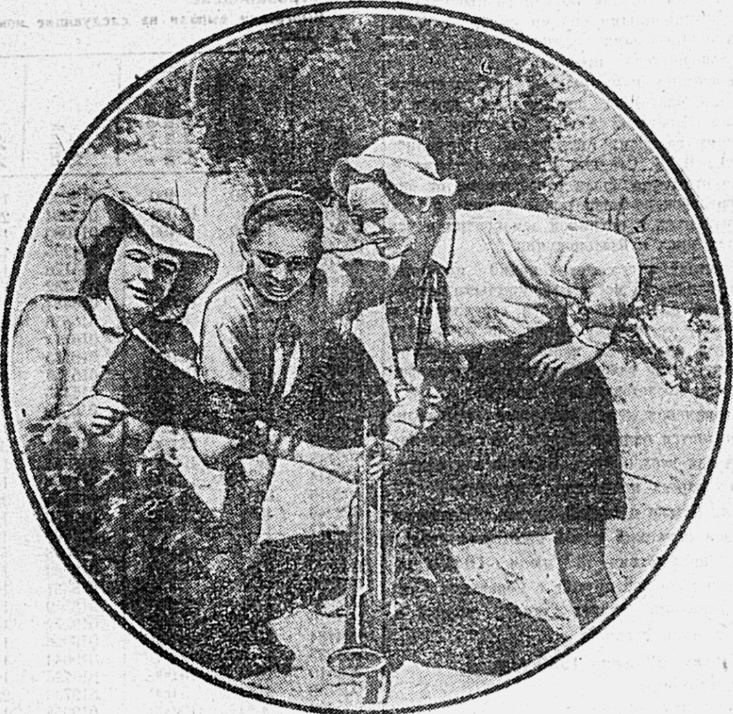
Юные натуралисты Хабаровского Дома пионера и школьника организовали экскурсию на левый берег Амура...