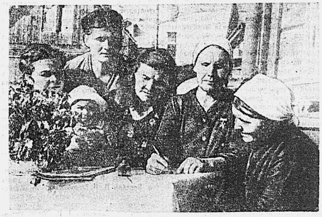
Сбор подписей под Стокгольмским Воззванием Постоянного комитета Всемирного конгресса сторонников мира о запрещении атомного оружия. На снимке: Воззвание подписывает мать-героиня М. Ф. КВЦ (г. Хабаровск, ул. им. Лукашова № 8).

Свое выступление тов. Стекольников закончил под аплодисменты всех присутствующих здравием в честь великого знаменосца мира товарища Сталина. Затем выступил заочный мастер тов. Пузаяв.