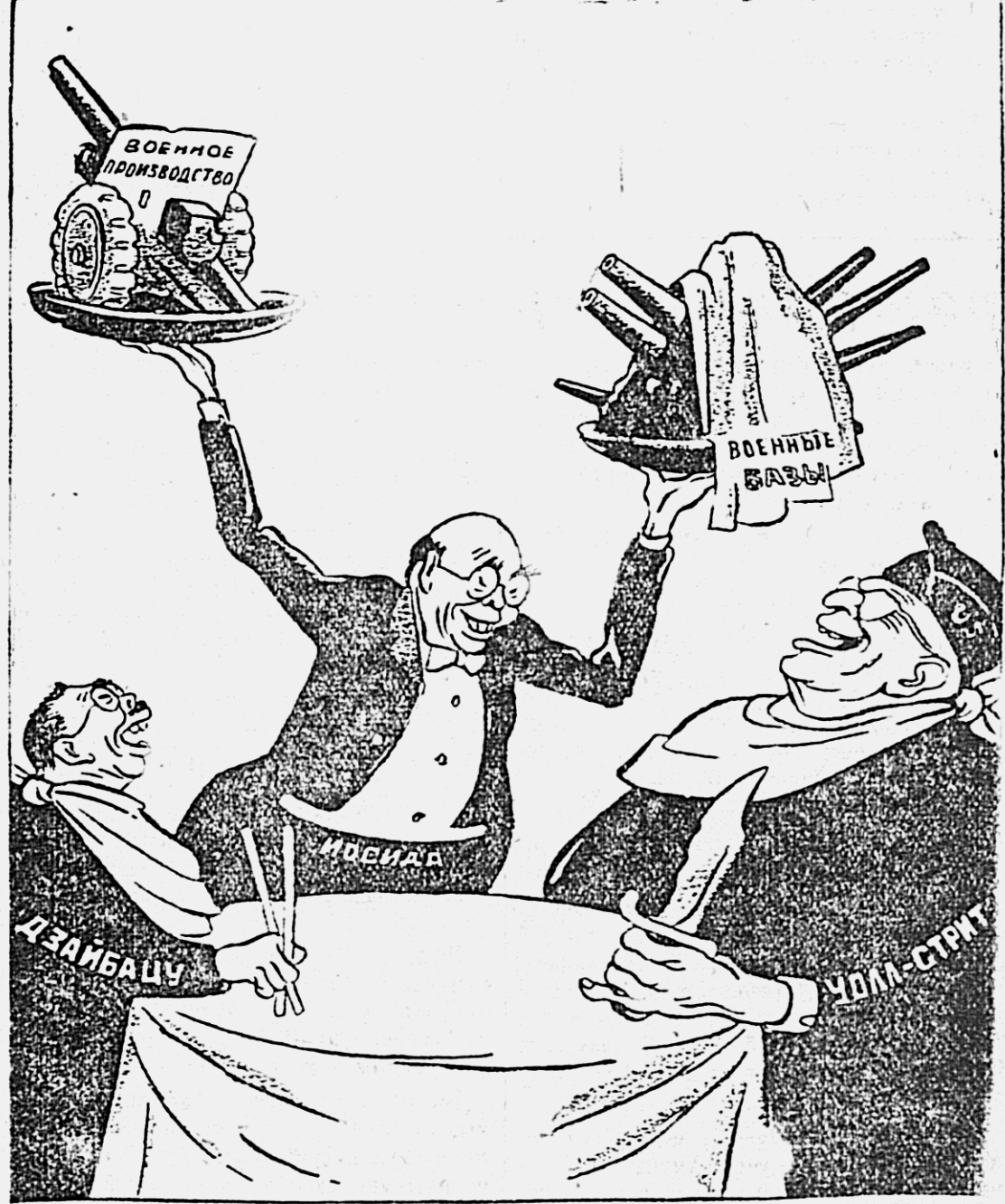
СЛУГА ДВУХ ГОСПОД Рис. В. Павничского.

3 августа футбольный матч ДОСА-2 (Хабаровск) — «Динамо» (Владивосток). Начало матча в 18 час. 30 мин. Цены на билеты снижены.