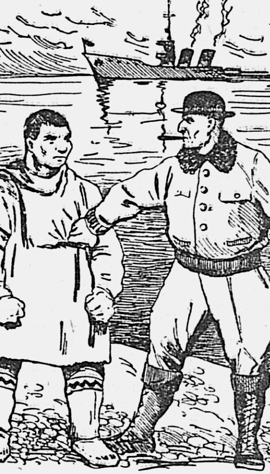
ОДНОТОМНИК ПРОИЗВЕДИЙ ПЕТРА КОМАРОВА