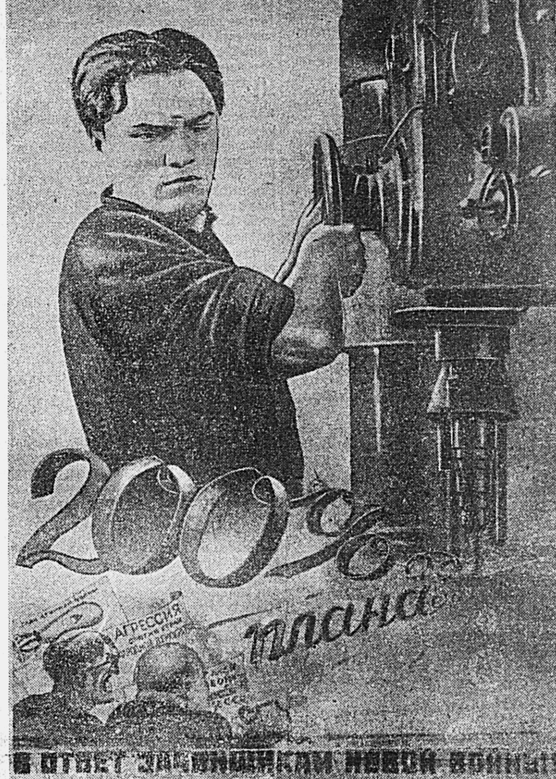
Плакат художника В. Корецкого, выпущенный издательством «Искусство».