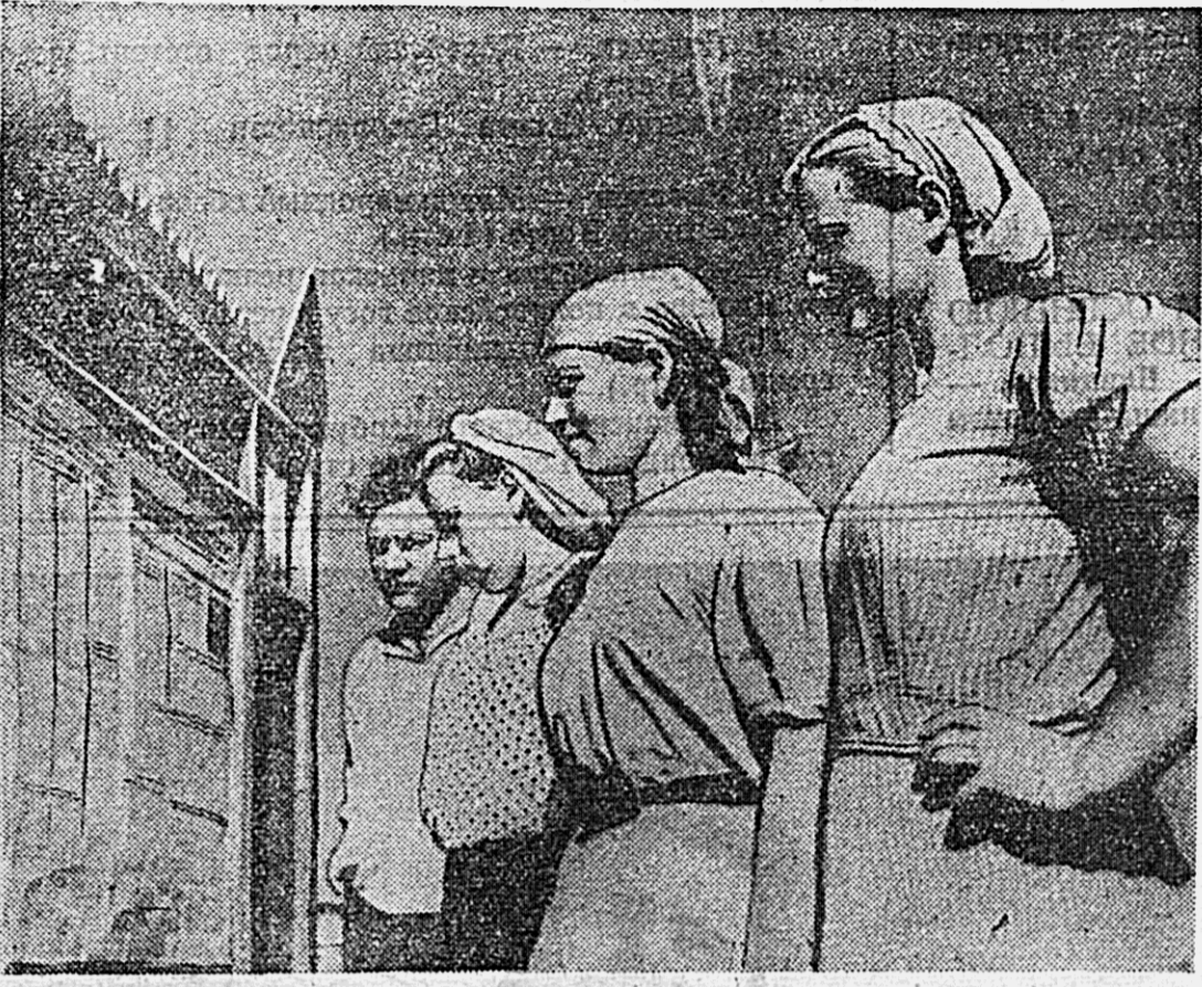
Хорошо поставлена агитационная работа в колхозе имени Кирова, Ленинского района. Агитаторы проводят чтения газет, беседы о внутреннем и международном положении СССР, выпускают «боевые листки». На снимке: члены сельхозартели читают свежий номер газеты, вывешенный на полевом стане.