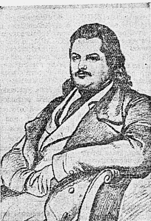
Оноре де БАЛЬЗАК

Выдающийся французский писатель Оноре Бальзак родился в г. Туре 20 мая 1799 года. Дед Бальзака — крестьянин из Лангедока; отец писателя был провинциальным чиновником. В 1814 г. семья Бальзака переехала в Париж. Бальзак обучается в школе права, служит писцом у нотариуса. С 1819 г. Бальзак посвящает себя литературе. Исторический роман «Шуаны» (1829 г.) кладет начало работе над произведениями, обличительным по своему характеру. Писатель называет «Человеческую комедию».