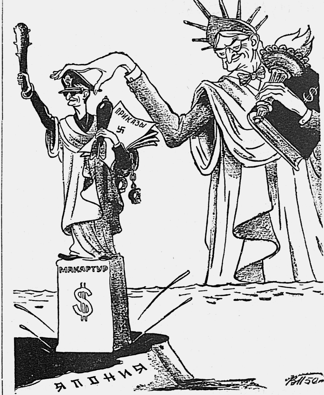
Отпрыск заокеанской «свободы». Рис. В. Павничского.

Американские оккупационные власти в Японии соорудили на главной торговой улице Токио «статую свободы» — точную копию нью-йоркской, только меньших размеров. (Из газет).