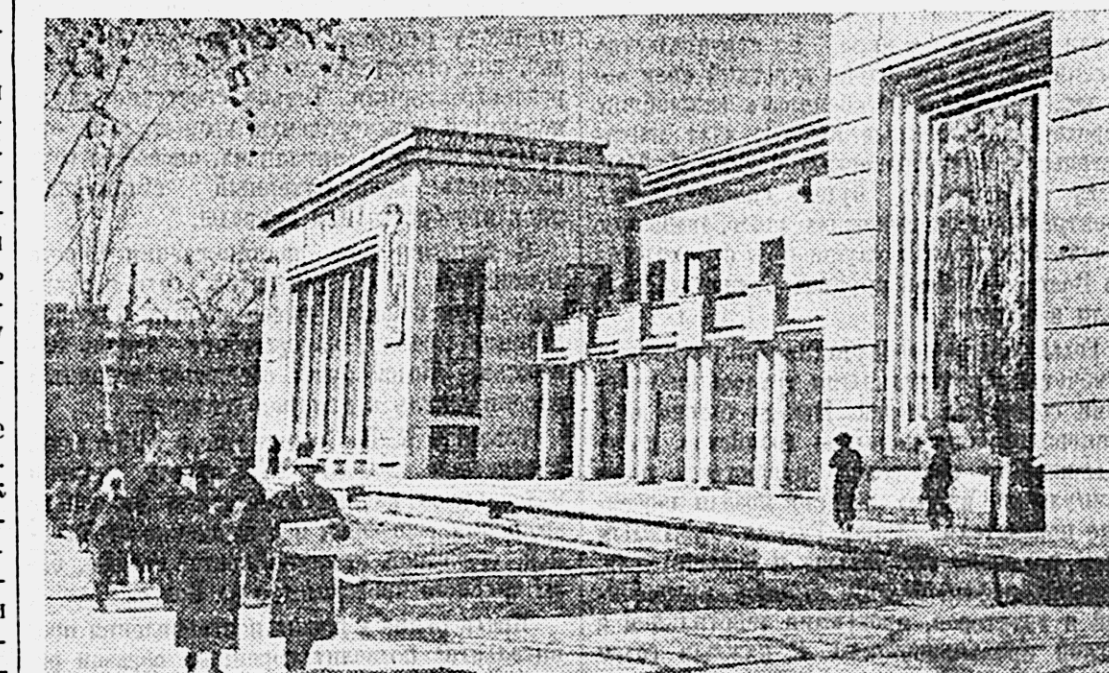
Столица Казахской ССР город Алма-Ата. На снимке: кинотеатр.

За нарушение Устава сельскохозяйственной артели районисполком вынес строгий выговор сечетоводу колхоза «Искра Хинга-