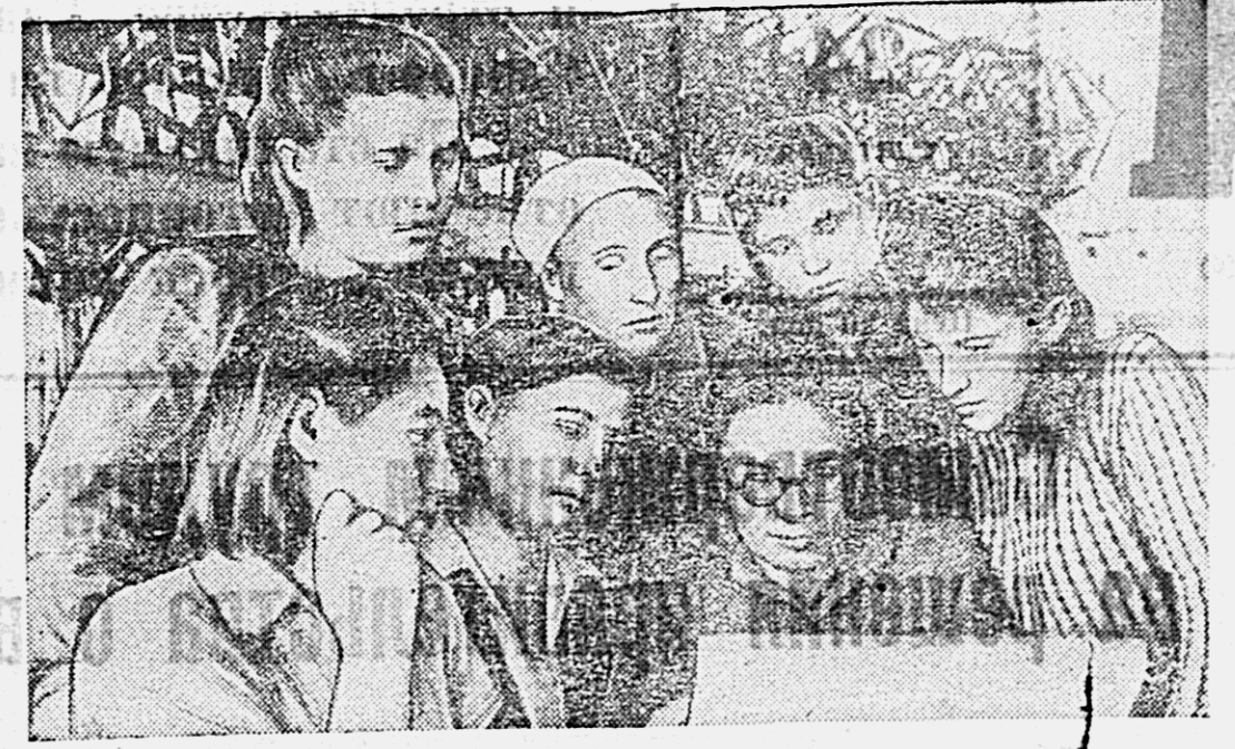
Хорошо поставлена агитационная работа в Биробиджанской трикотажной артели «Работница». Агитаторы проводят читки газет, беседы о внутреннем и международном положении СССР, регулярно выпускают стенную газету.