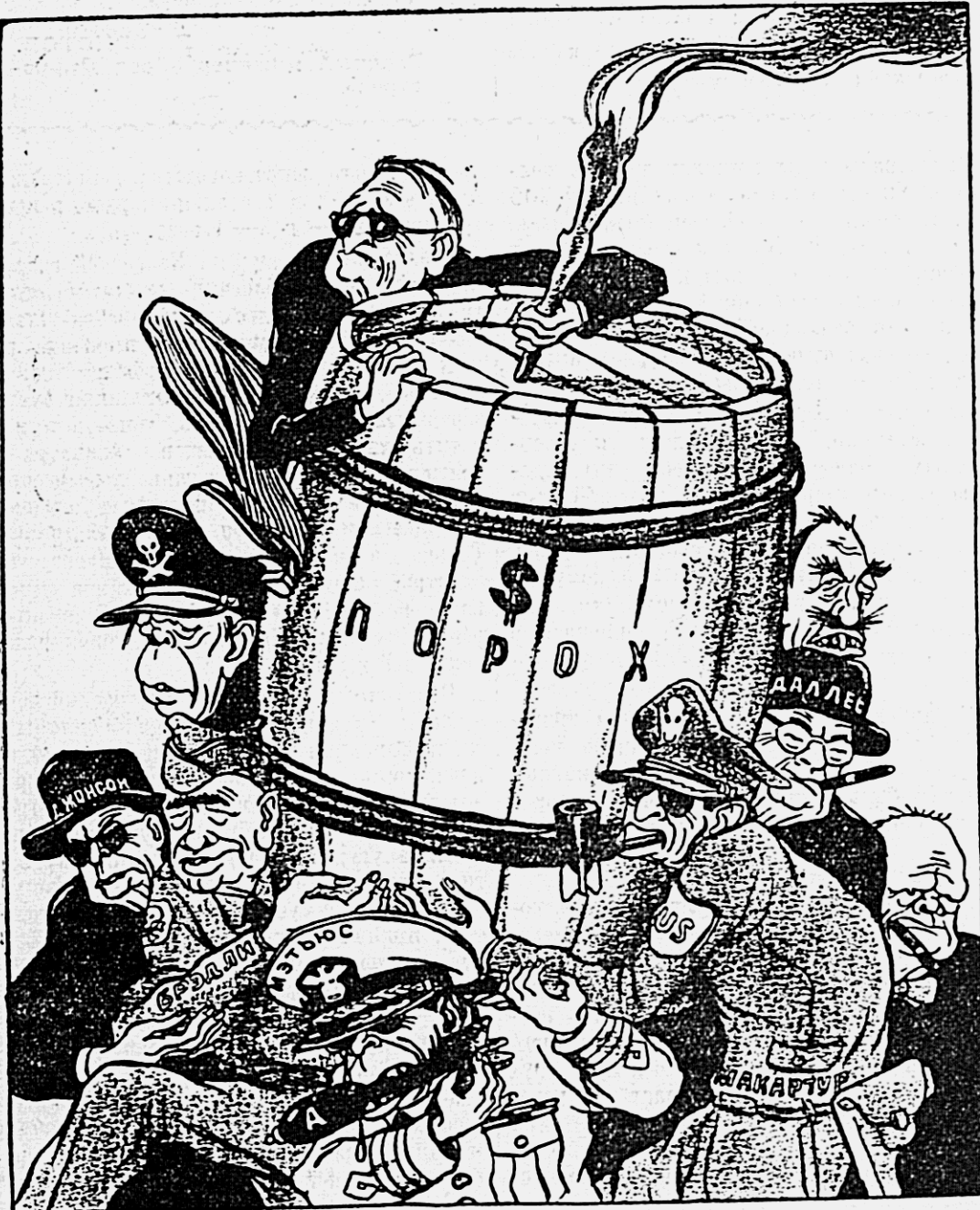
США — Яка поджигателей войны. Рис. В. Павчинского.