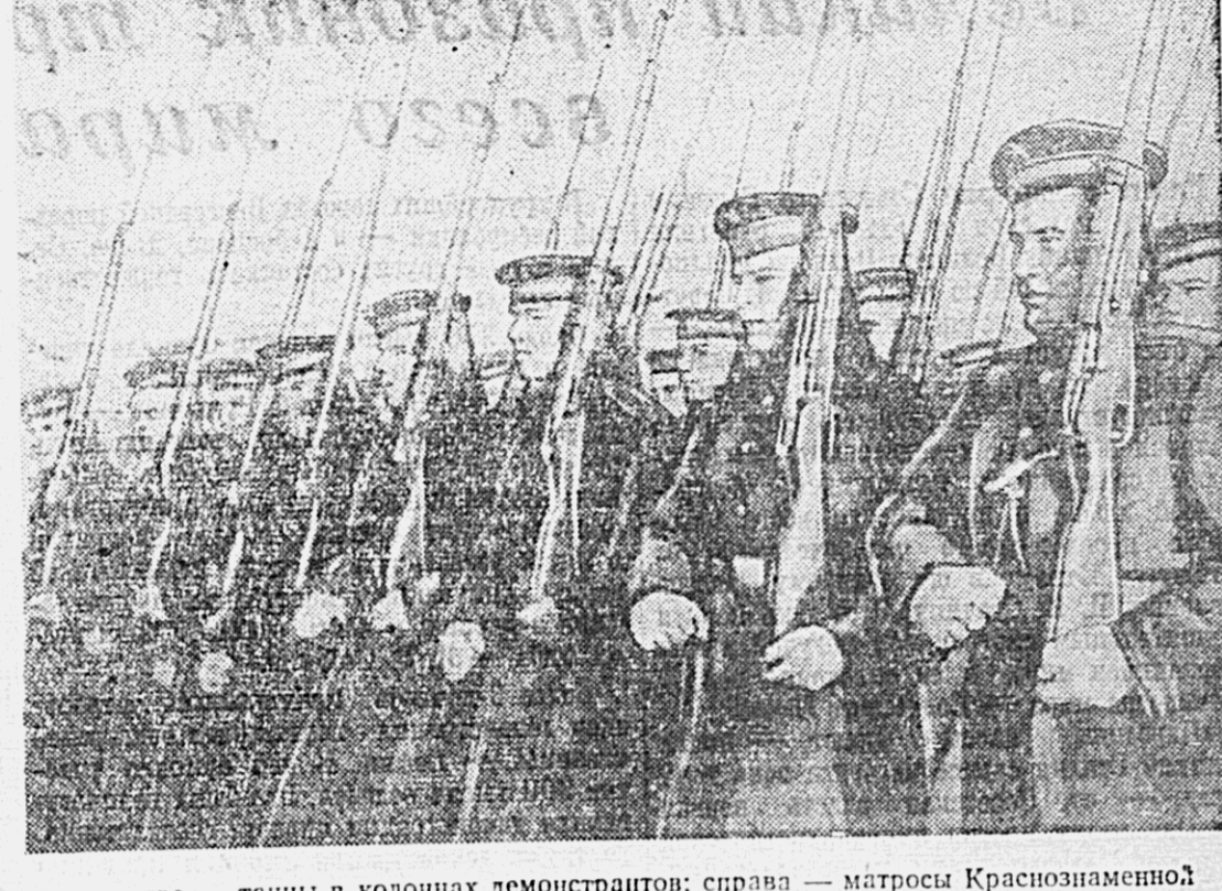
Празднование 33-й годовщины Великой Октябрьской социалистической революции в Амурской флотилии на параде.