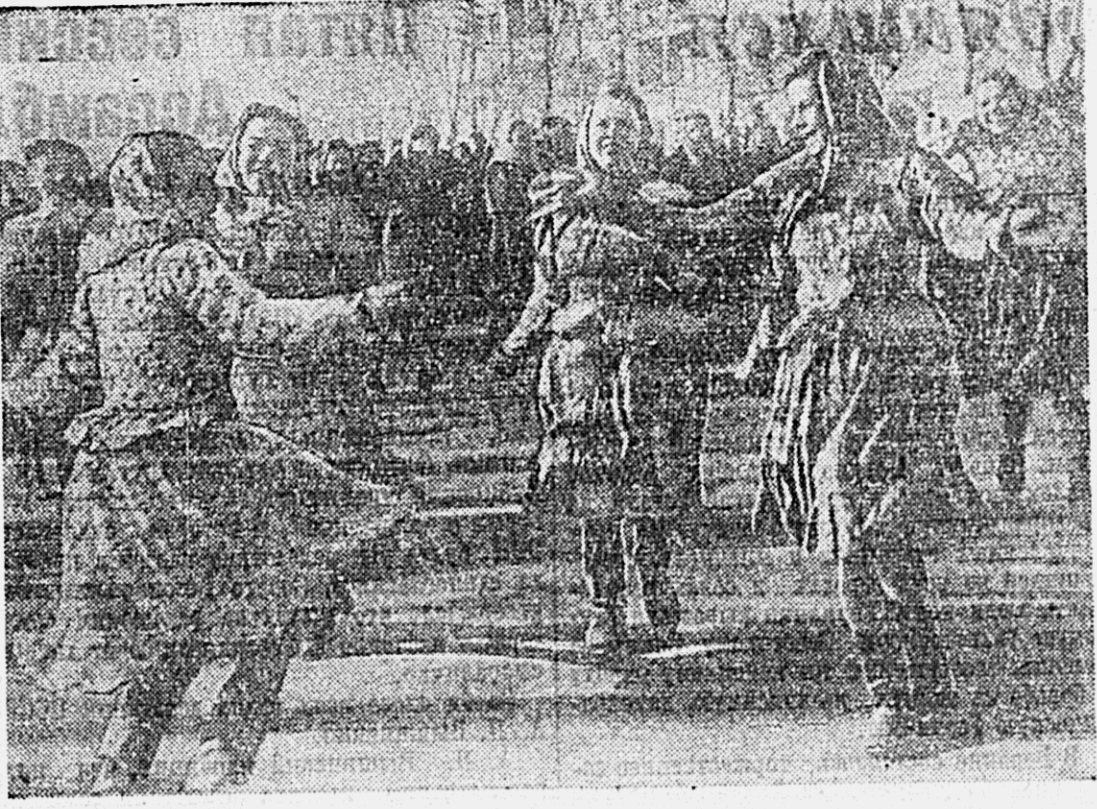
в г. Хабаровске. На снимках: слева — учащиеся ремесленных училищ на демонстрации; в центре — танцы в колоннах демонстрантов; справа — матросы Краснознаменной флотилии.