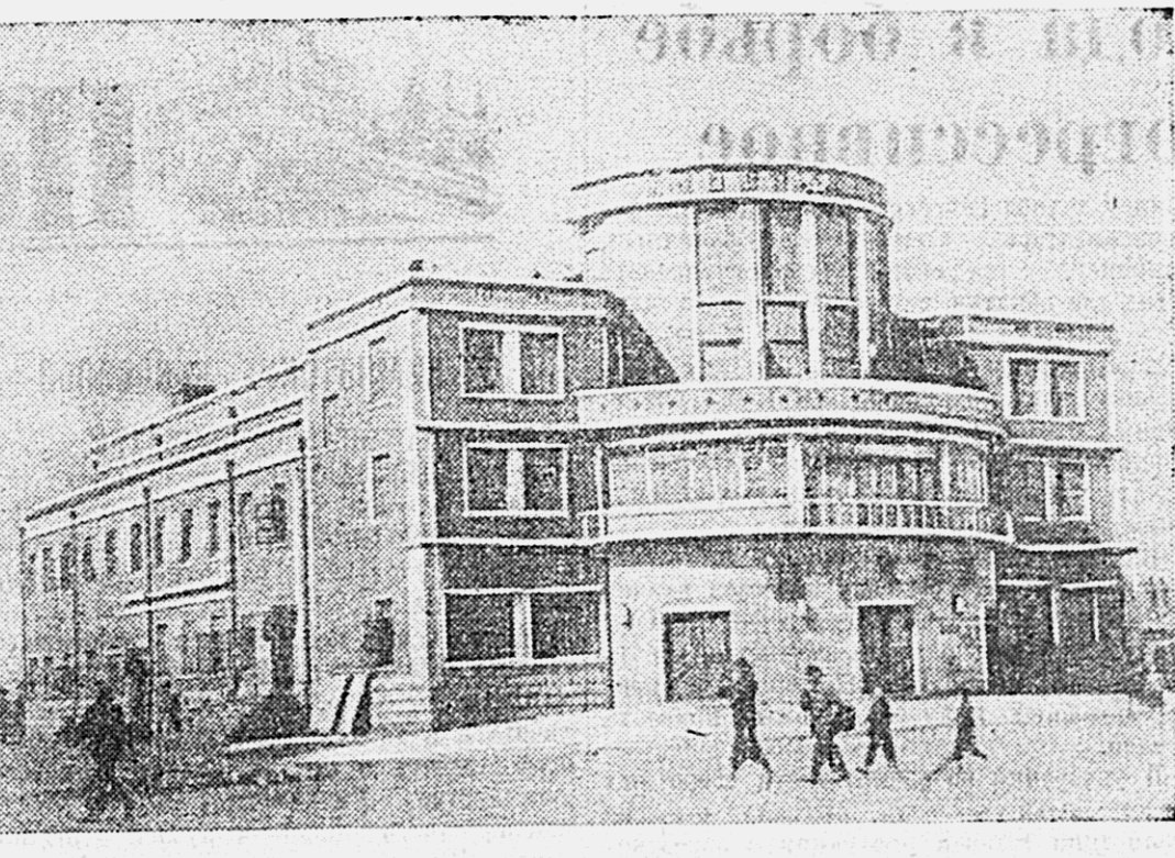
Правительство Китайской Народной Республики всемерно содействует развитию искусства в стране. Премьер Государственного административного совета Центрального Народного Китая, Фанг Цзы-лай пишет: «Молодое киноискусство достигло успехов среди широких народных масс и постепенно проникает в воинские части, на заводы и в деревни».

ТЕАТР ДРАМЫ. 25 ноября — «Тайная война», 26 ноября — «Семья», вечером — «Тайная война». Начало дневного спектакля в 12 часов, вечерних в 20 час. 30 мин. В фойе играет оркестр.