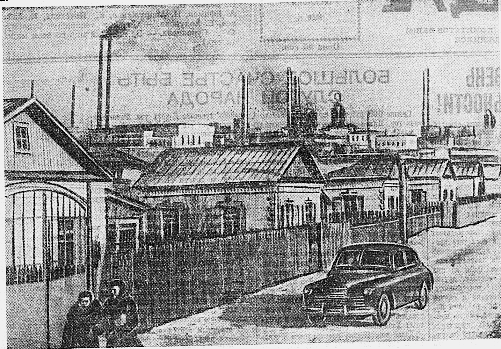
Тысячи квадратных метров жилой площади получили за годы послевоенной сталинской пятилетки рабочие и служащие Хабаровского завода им. С. Орджоникидзе. На снимке: новая Стахановская улица в рабочем поселке завода.