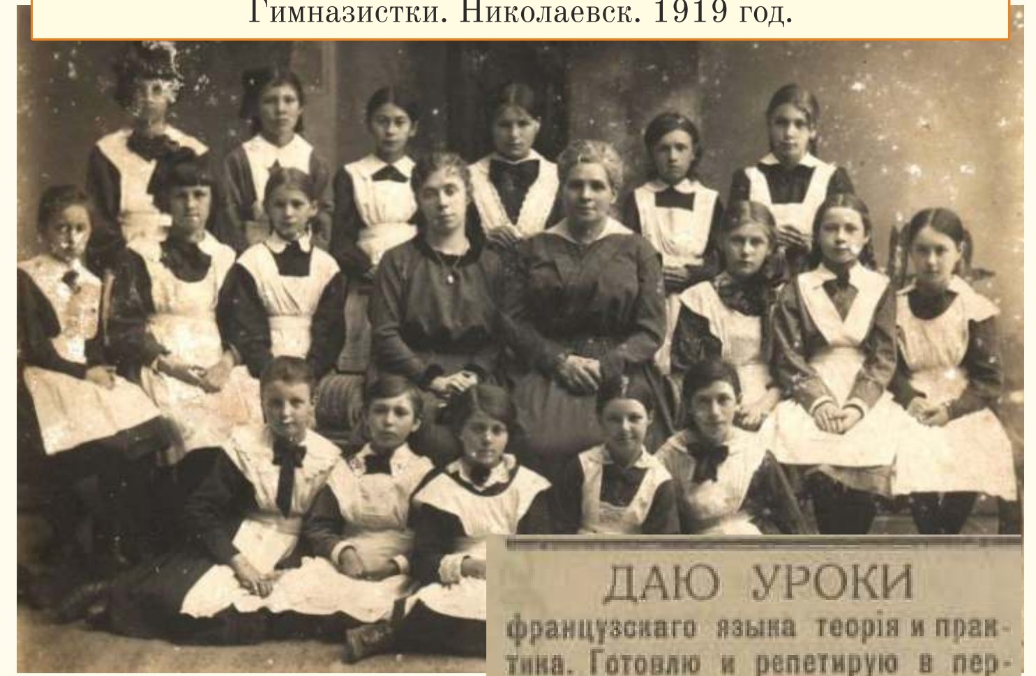
Гимназистки. Николаевск. 1919 год.