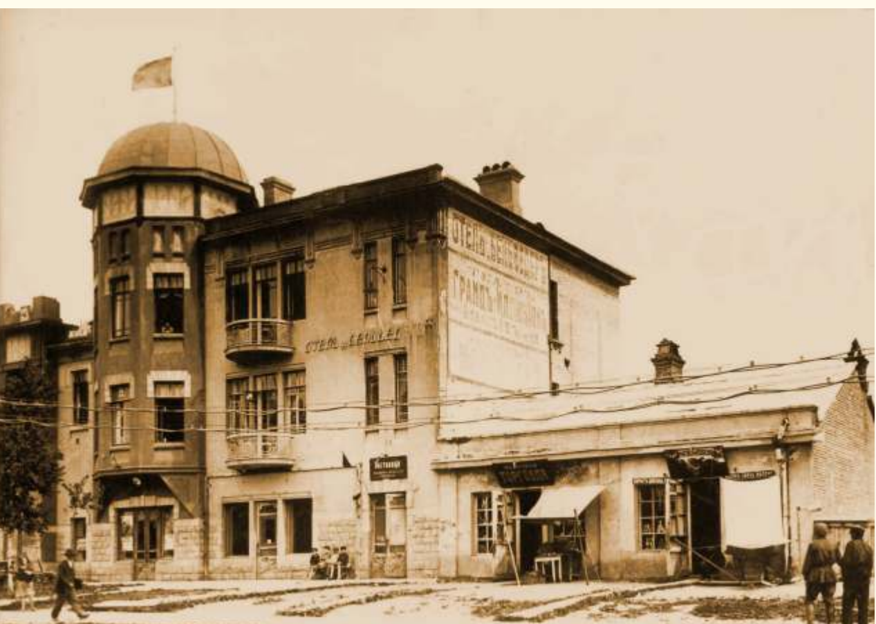
Кинотеатр «Гранд-Иллюзион» просуществовал до октября 1922 г.