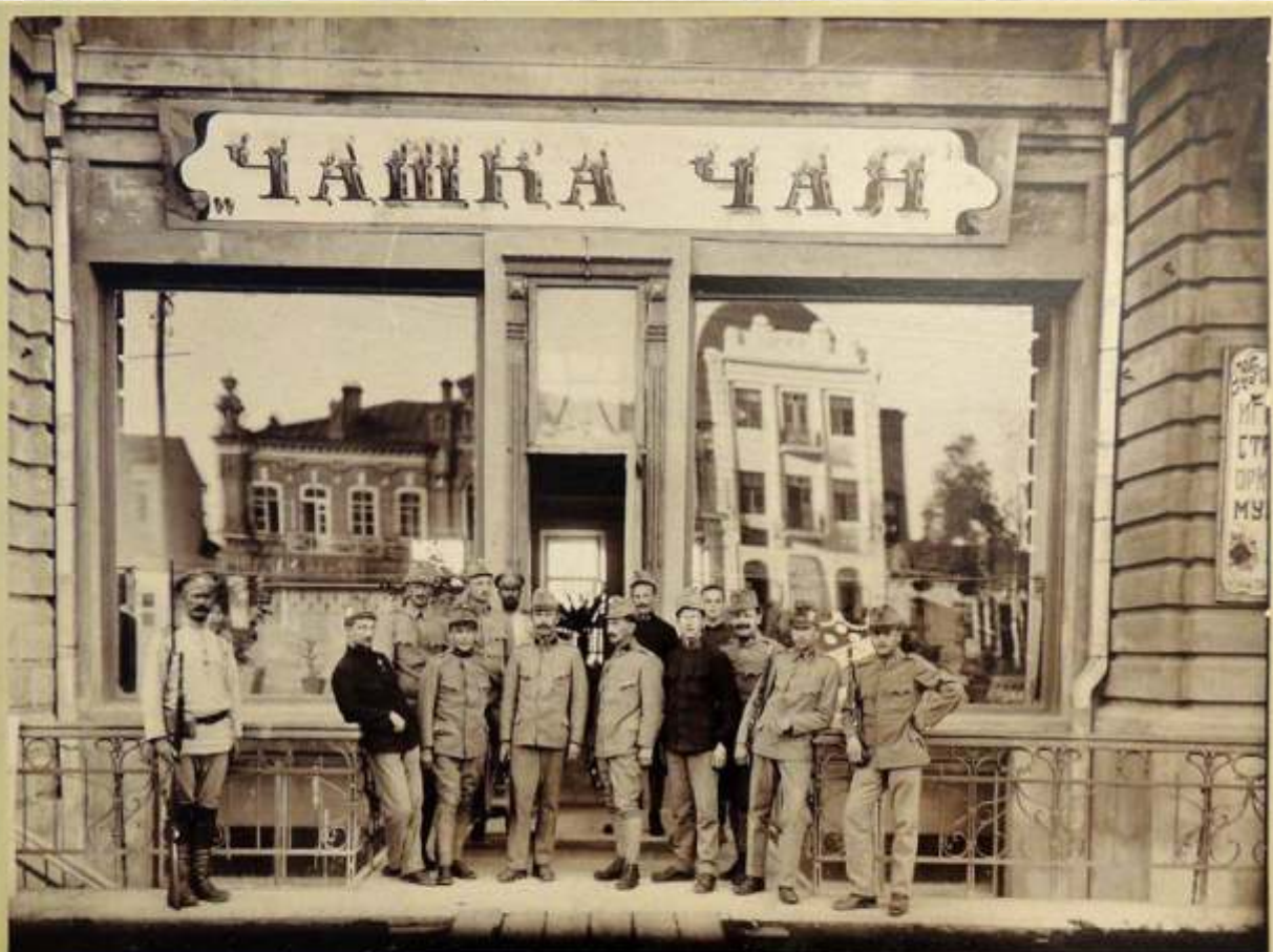
Оркестр дамаскенинских восточных танцев

В Хабаровске по инициативе дамского кружка был организован струнный оркестр при кофейне «Чашка чая». Все оркестранты были выпускниками Венской консерватории. С декабря 1915 г. вплоть до своей трагической гибели в сентябре 1918-го оркестр пользовался большой популярностью в городе. 5 сентября 1918 г., когда в Хабаровке вошли отряды атамана Калмыкова и чешские легионеры, музыканты были расстреляны.