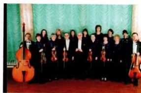
Камерный оркестр Дальневосточной филармонии «Серенада»