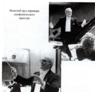
Незаслуженный труд, дирижер симфонического оркестра