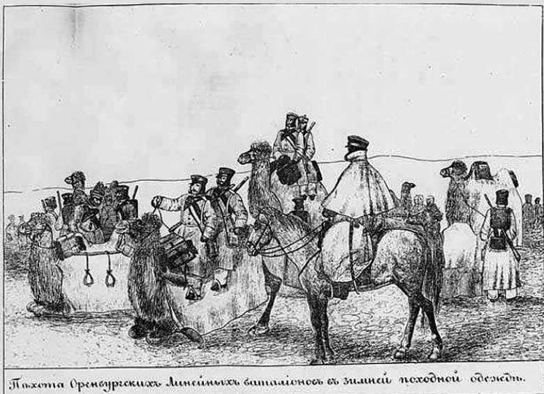
Похота Оренбургских Линейных батальонов с записей походной описки.