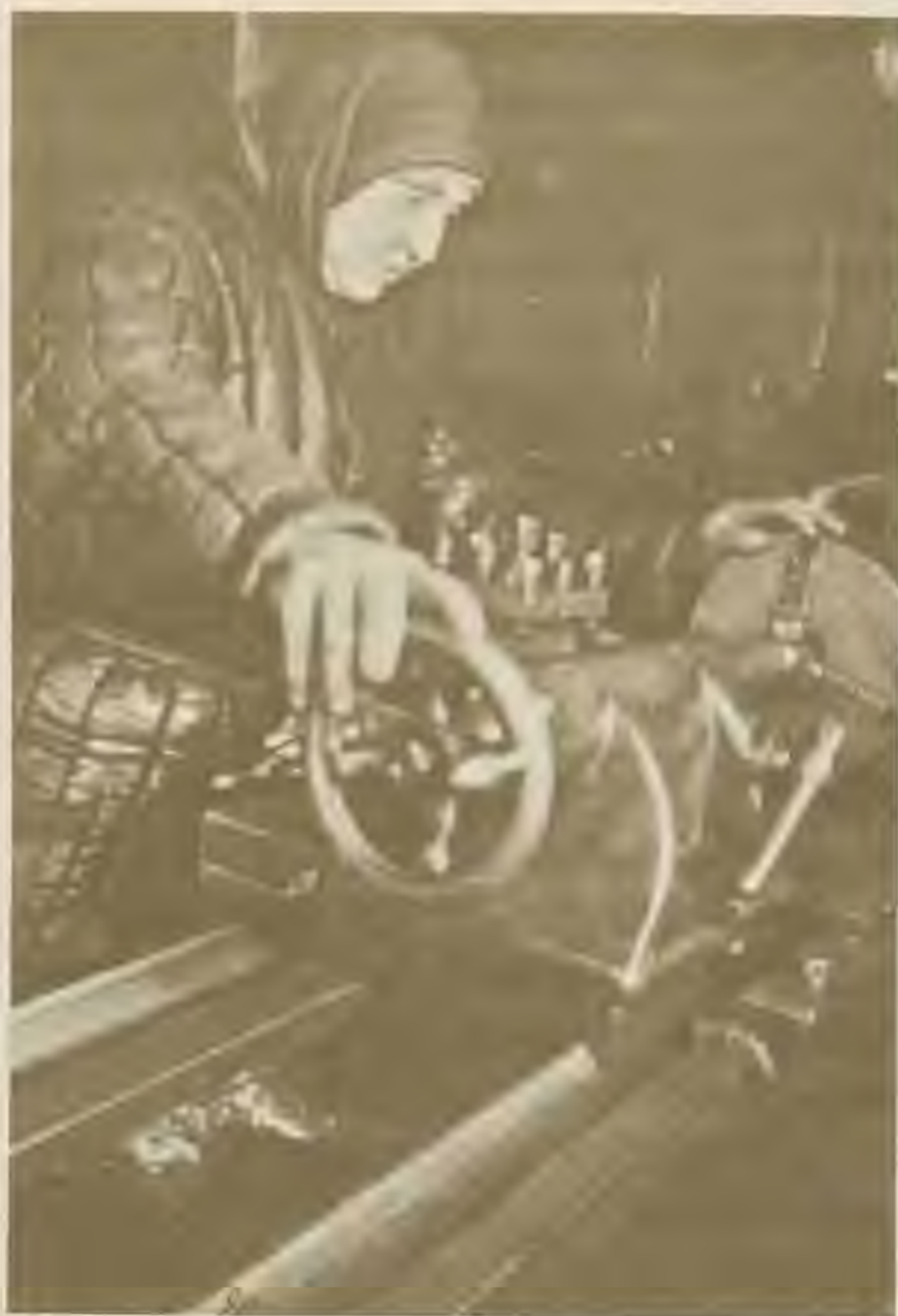
В годы войны сотни дальневосточниц заменили у станков своих мужей и отцов