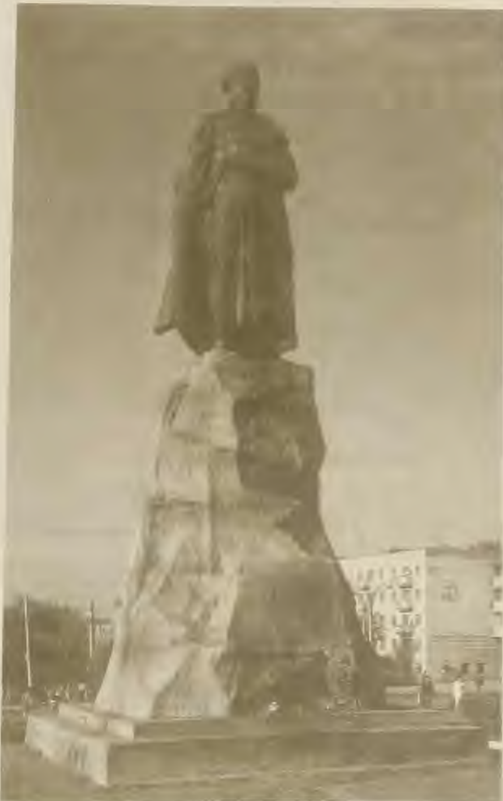
Памятник Е. П. Хабарову, 80-е годы

Ерофей Павлович Хабаров – русский землепроходец XVII века. Его имя осталось в истории как одного из первых исследователей Приамурья. Его заслуги по освоению новых земель были оценены по достоинству, он получил звание «сына боярского». Походы Хабарова положили начало освоению и заселению русскими людьми приамурских земель, присоединению их к России.