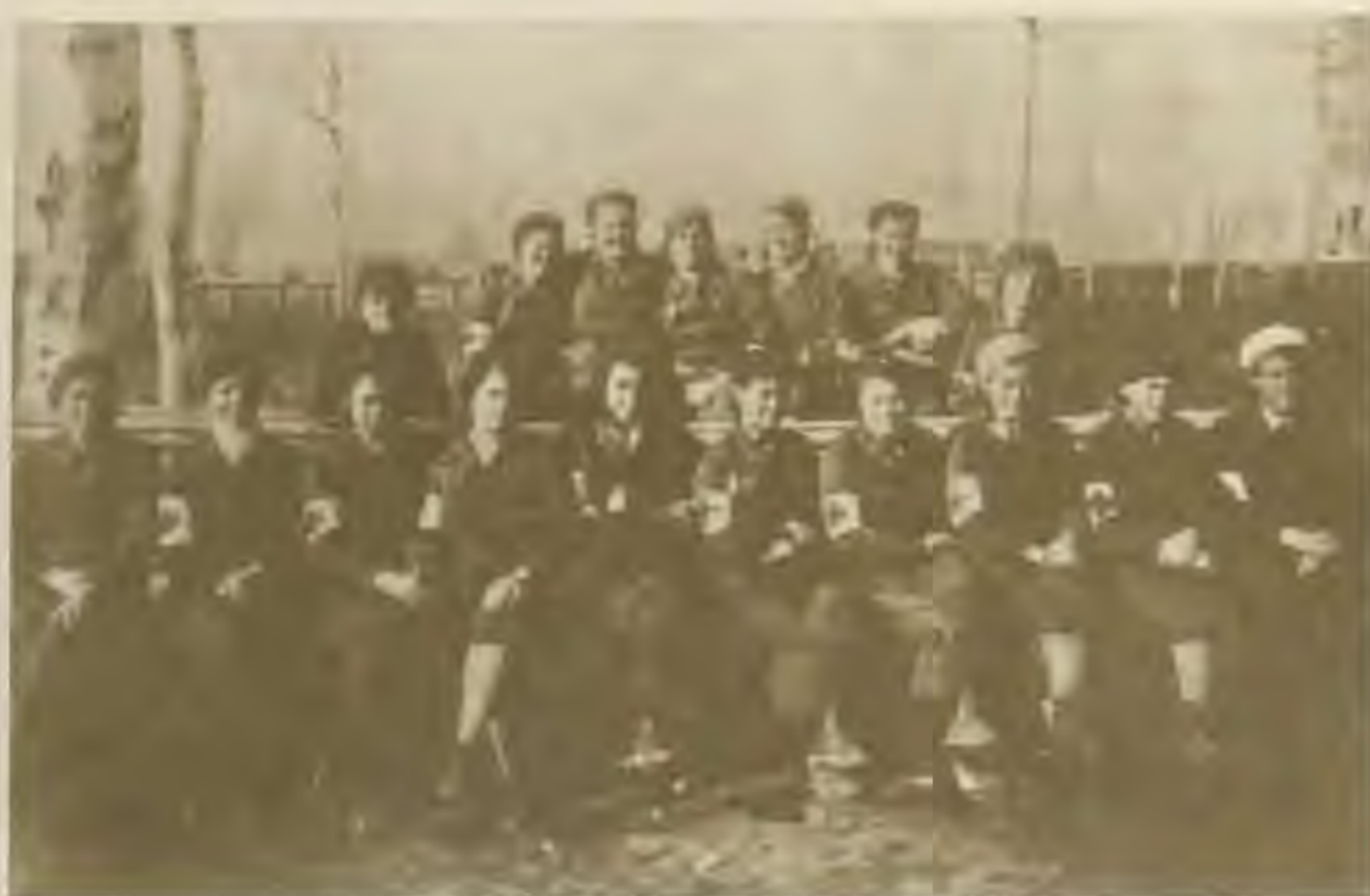
Женщины сандружинницы в годы войны