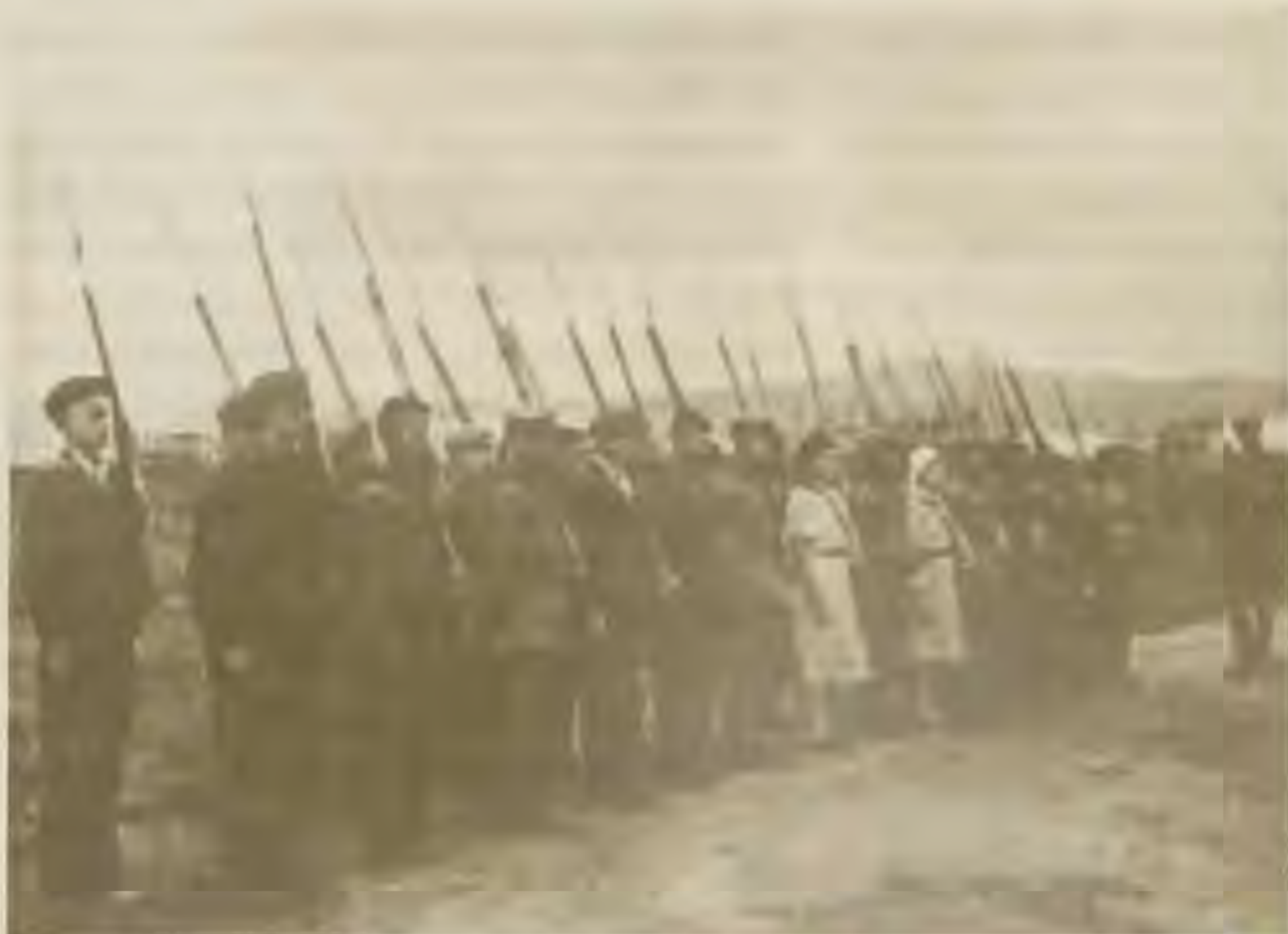
Стрелковые занятия для учащихся ремесленных училищ были обязательными, 1942 год

В самом начале войны в краевой газете «Тихоокеанская звезда» среди многочисленных откликов на нагрянувшую беду, было и обязательство студентов