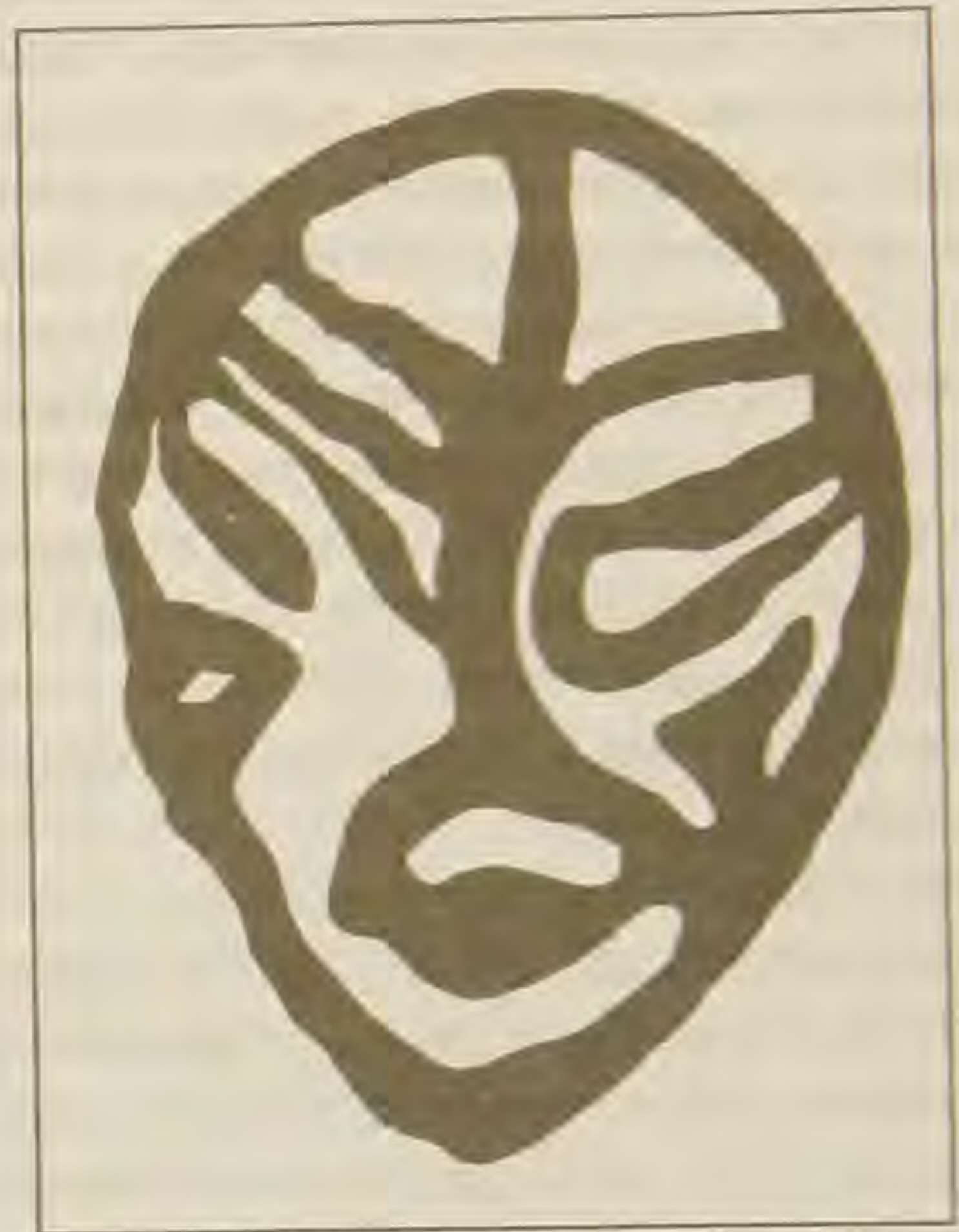
Рис. 2. Сикачи-Алян. Классификация по стилю изображения. Тип «Реалистические личины».