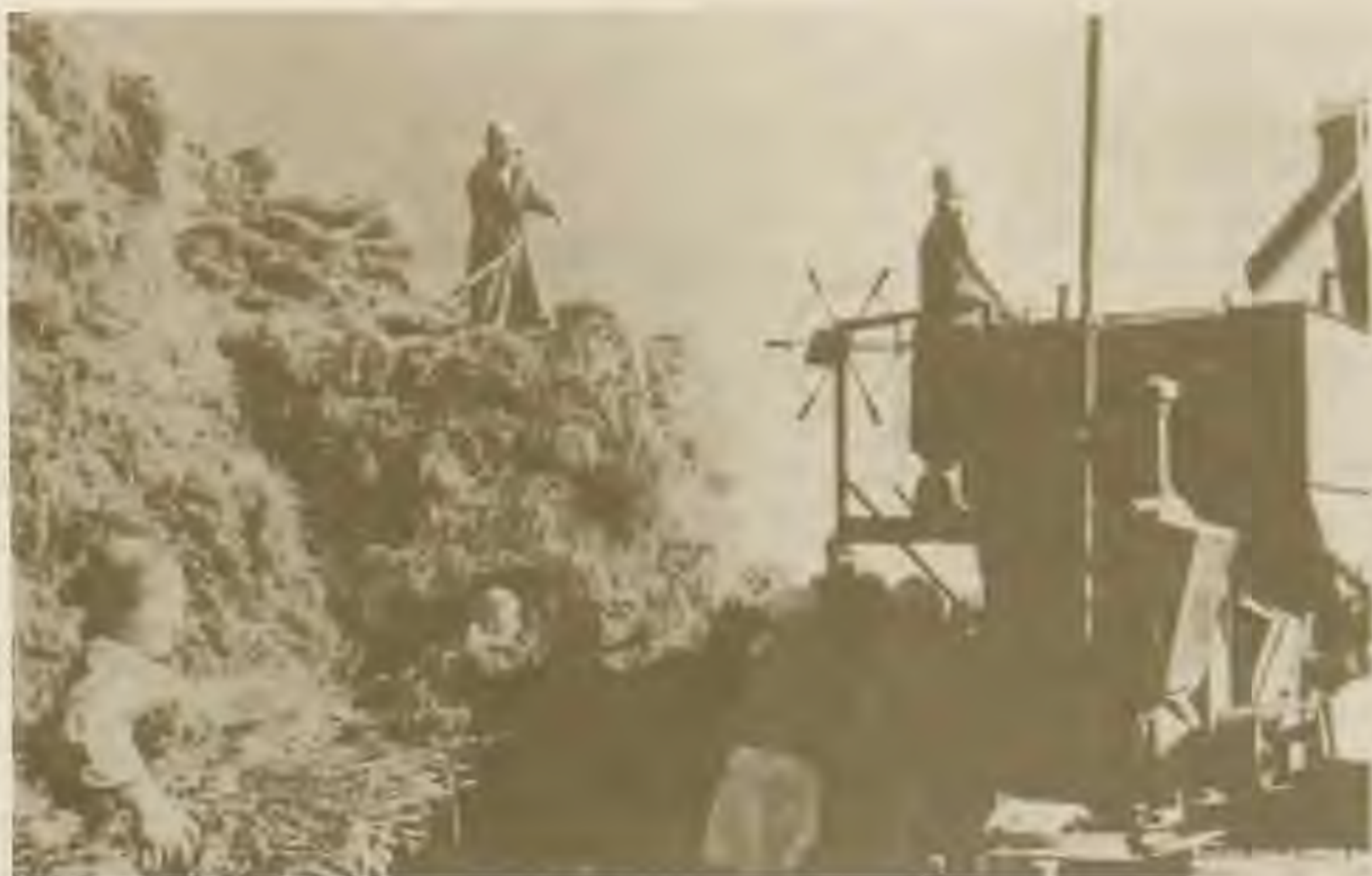
Все сельскохозяйственные работы в годы войны выполняли женщины и подростки

Лазо был учреждён приз имени Героя Социалистического труда А.Г. Антоновой [13, с. 161–162].