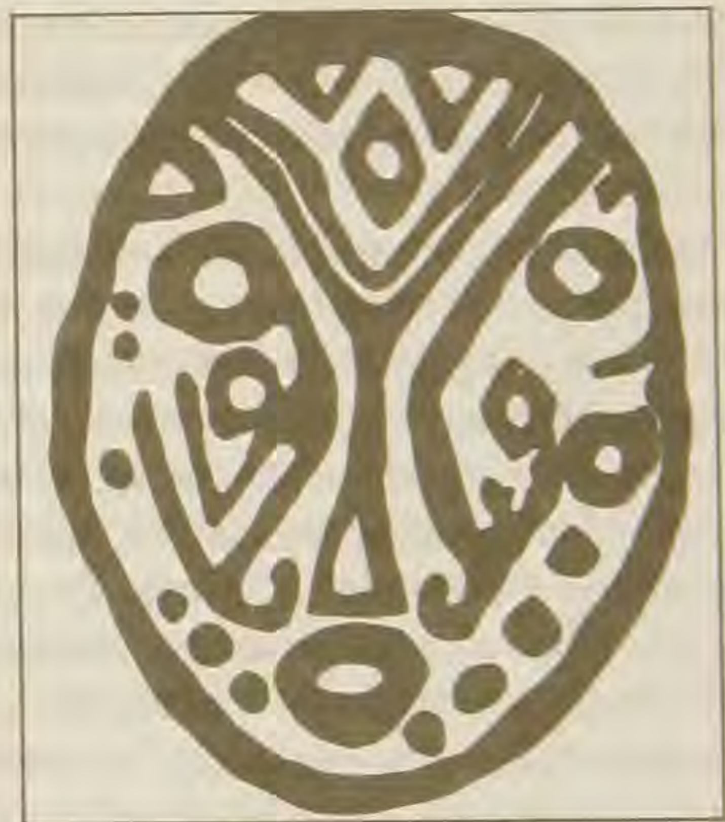
Рис. 4. Сикачи-Алян. Классификация по стилю изображения. Тип «Личины с орнаментальным оформлением».