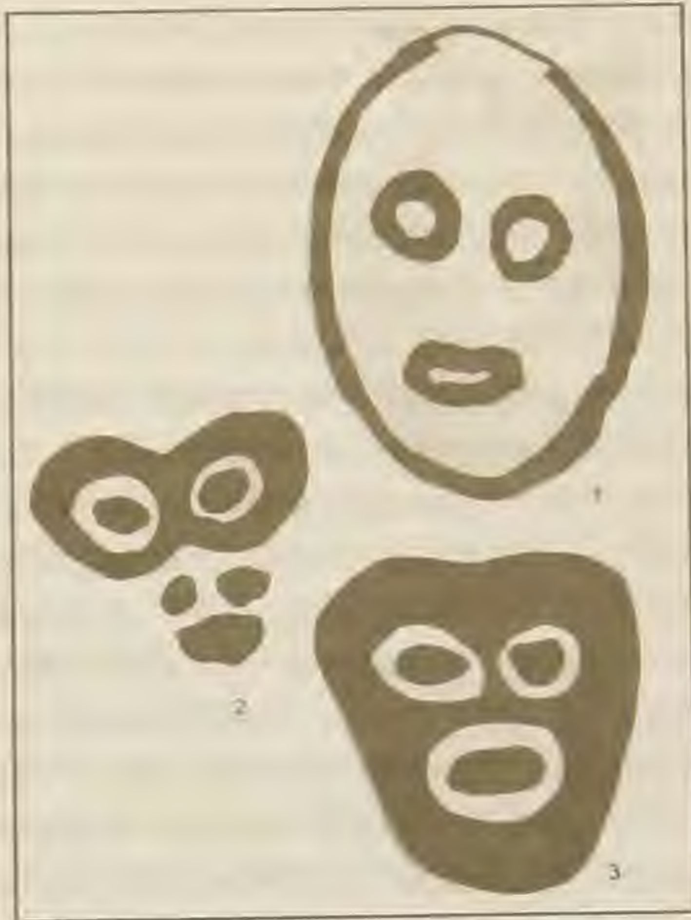
Рис. 1. Сикачи-Алян. Классификация личин по технике исполнения рисунка: 1- контурные, 2 — бесконтурные, 3 — силуэтные.