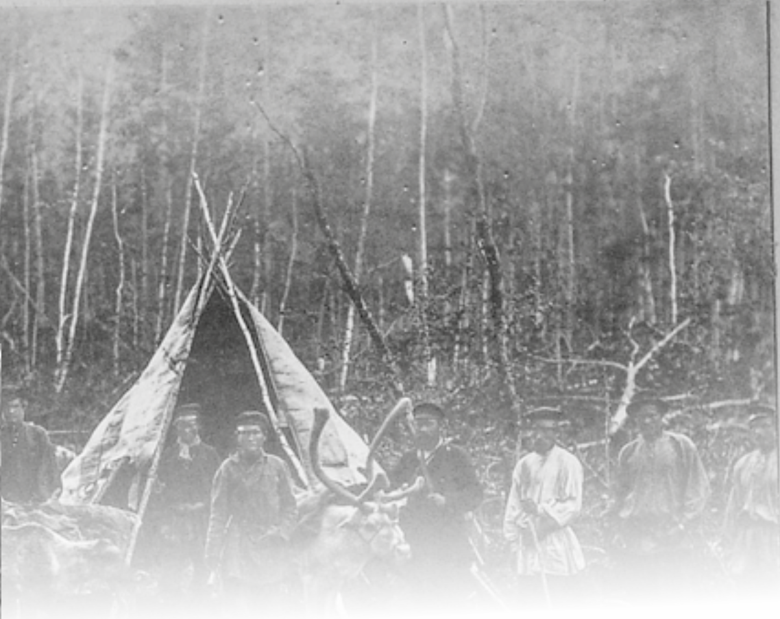
ЗАГОРОДНЯЯ КРИСТИНА АНДРЕЕВНА