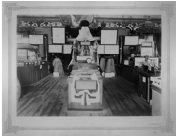
Интерьер Дальневосточного павильона на Всероссийской Нижегородской выставке 1896 года. Фотография отпечатана на фирменном бланке фотоателье М. П. Дмитриева.

папка, получившая название «Павильон Дальнего Востока на Всероссийской Новгородской выставке в 1896 г.», в ней 10 планшетов со снимками известного нижегородского фотографа Максима Петровича Дмитриева.