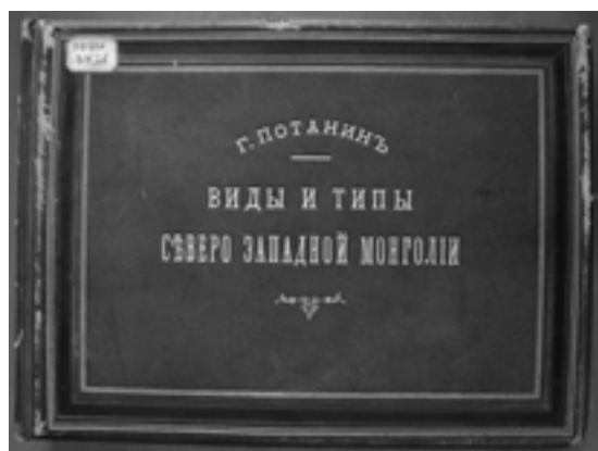
Фотоальбом «Виды и типы северо западной Монголии», подаренный цесаревичем Николаем Александровичем.