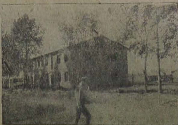
Биробиджан. Новый вид глиноблочных домов

Таков краткий итог работы организаций по содействию Всесоюзному Озету в разных странах.