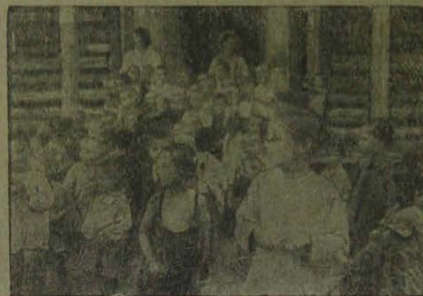
Биробиджан. Колхоз Валдгейм. Детский сад

Основная задача, стоящая перед всеми гезердовскими организациями за границей, — это упорная и неустанная борьба с фашизмом. Они должны усилить свою связь с рабочим классом, шире развернуть разъяснительную работу вокруг соцстроительства Биробиджана, этого яркого проявления ленинской национальной политики в отношении евр. трудящихся.