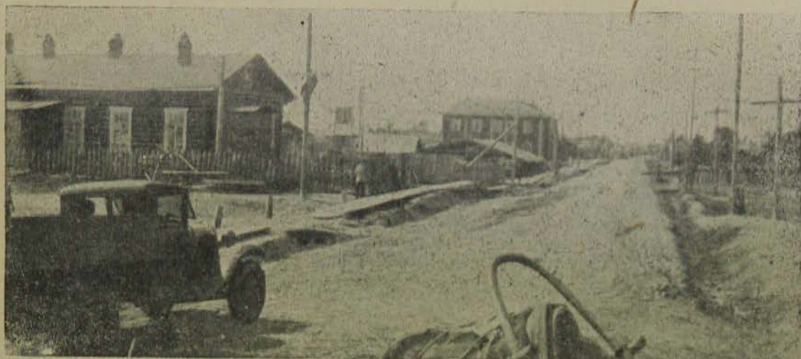
Улица в гор. Биджане.

Одновременно с территориалистами зашевелились и старые еврейские землеустроители ортовского пошиба. Эти сионисты без «морской качки» и без бальфууровской декларации задумали превратить еврейских безработных Америки в фермеров. В Нью-Йорке образовалась инициативная комиссия по землеустройству евреев в САСШ. Эта комиссия выпустила воззвание к еврейскому народу, где сказано: «нынешнее положение евреев в Америке требует самого серьезного внимания. Огромная безработица и обнищание—не только результат общего кризиса, но также следствие особой еврейской экономической структуры. Необходимо искать пути к оздоровлению и укреплению еврейских позиций в Америке. Мы убеждены, что землеустройство евреев на прогрессивных началах очень много поможет разрешению этой проблемы».