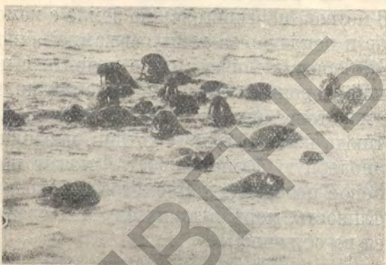
Чукотский полуостров. Стадо моржей в море.

На берегу моржи производят впечатление беспомощных животных. Целыми часами они лежат в неподвижных позах среди своих слизистых испражнений, лежат до тех пор, пока не подойдет прилив и сама вода не снимет их