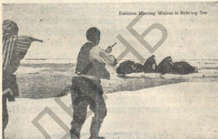
Бой облежавшихся моржей на льдине.

При нанесении удара острый железный наконечник глубоко входит в тело животного. Раненый зверь бросается вперед и тем выдер-