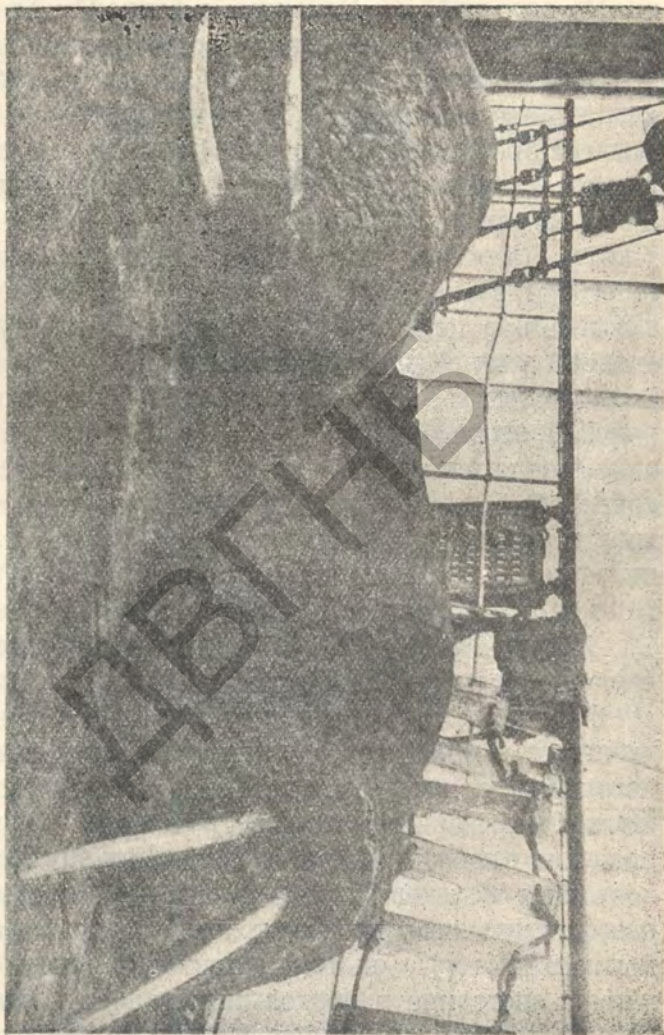
Убитые моржи на палубе судна.