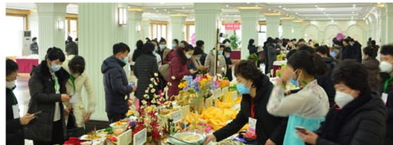
XI конкурс по кулинарной технике по случаю Дня Звезды.