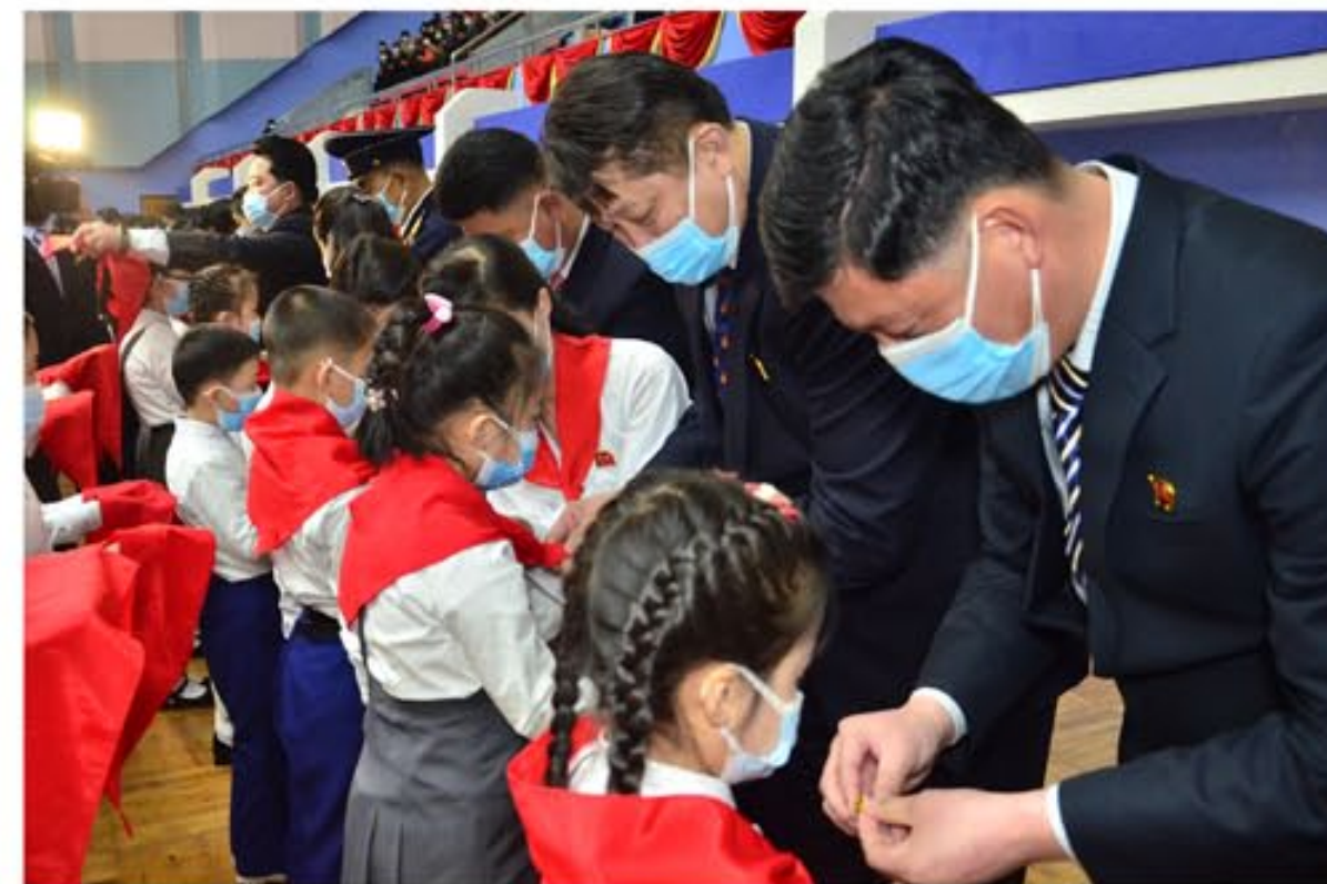
Общереспубликанский слет объединенных организаций Детского союза Кореи в честь 81-летия со дня рождения Ким Чен Ира.