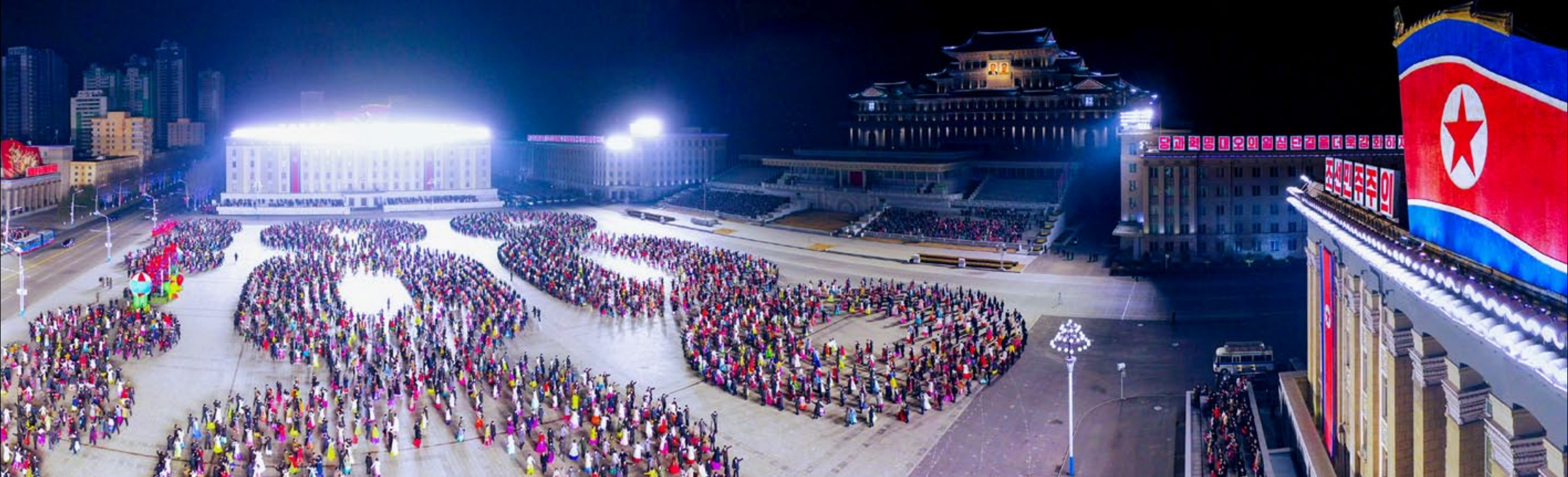
На Площади им. Ким Ир Сена устроен вечер молодежи и учащихся в честь Дня Звезды.