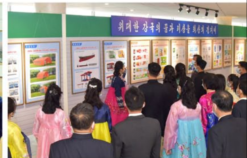
По случаю 81-летия со дня рождения Ким Чен Ира состоялись фотовыставка «Во имя процветания Родины и счастья народа», Центральная художественная выставка, выставка промышленных дизайнов г. Пхеньяна.