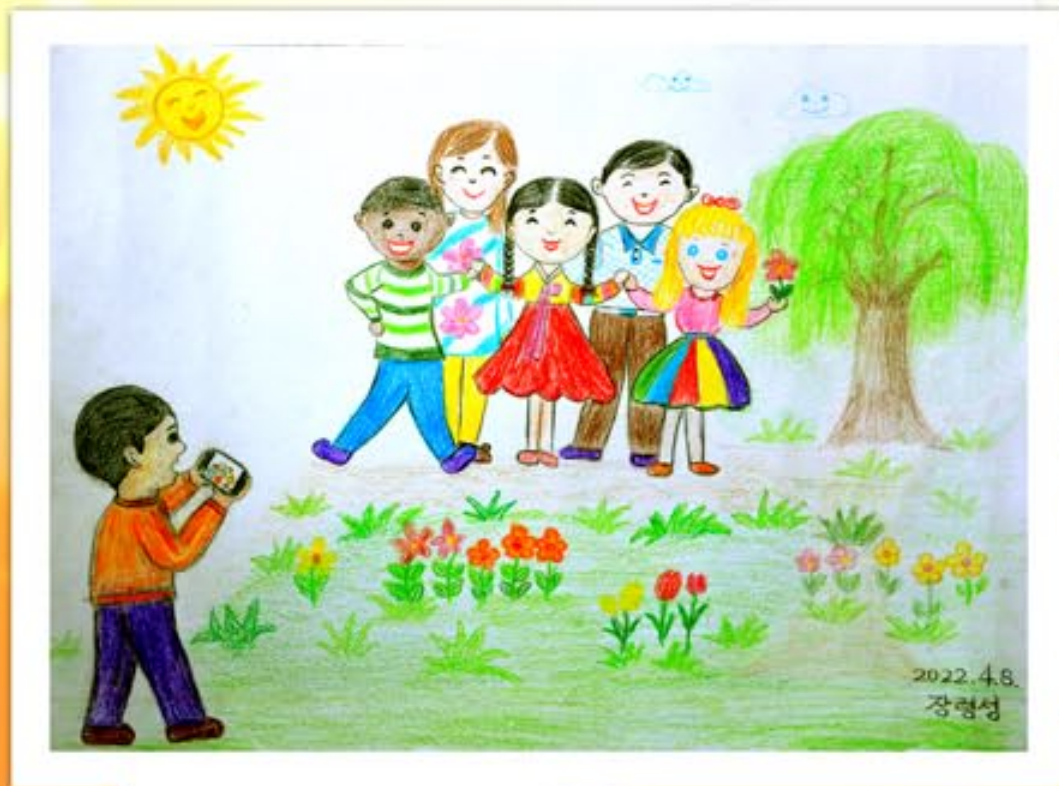
«Вместе фотографируемся» (Чан Рён Сон), третье место.