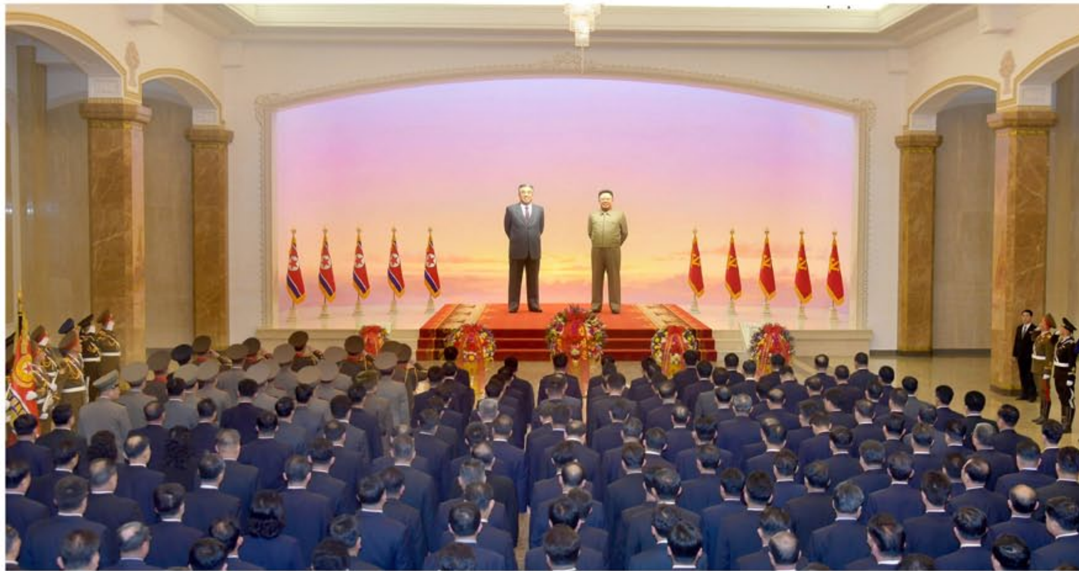
По случаю Дня Звезды кадры ТПК и правительства посетили Кымсусанский Дворец Солнца и выразили глубокое почтение.