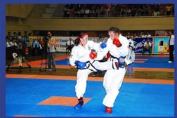
На 17-м чемпионате мира по тхэквондо. 2011 г.