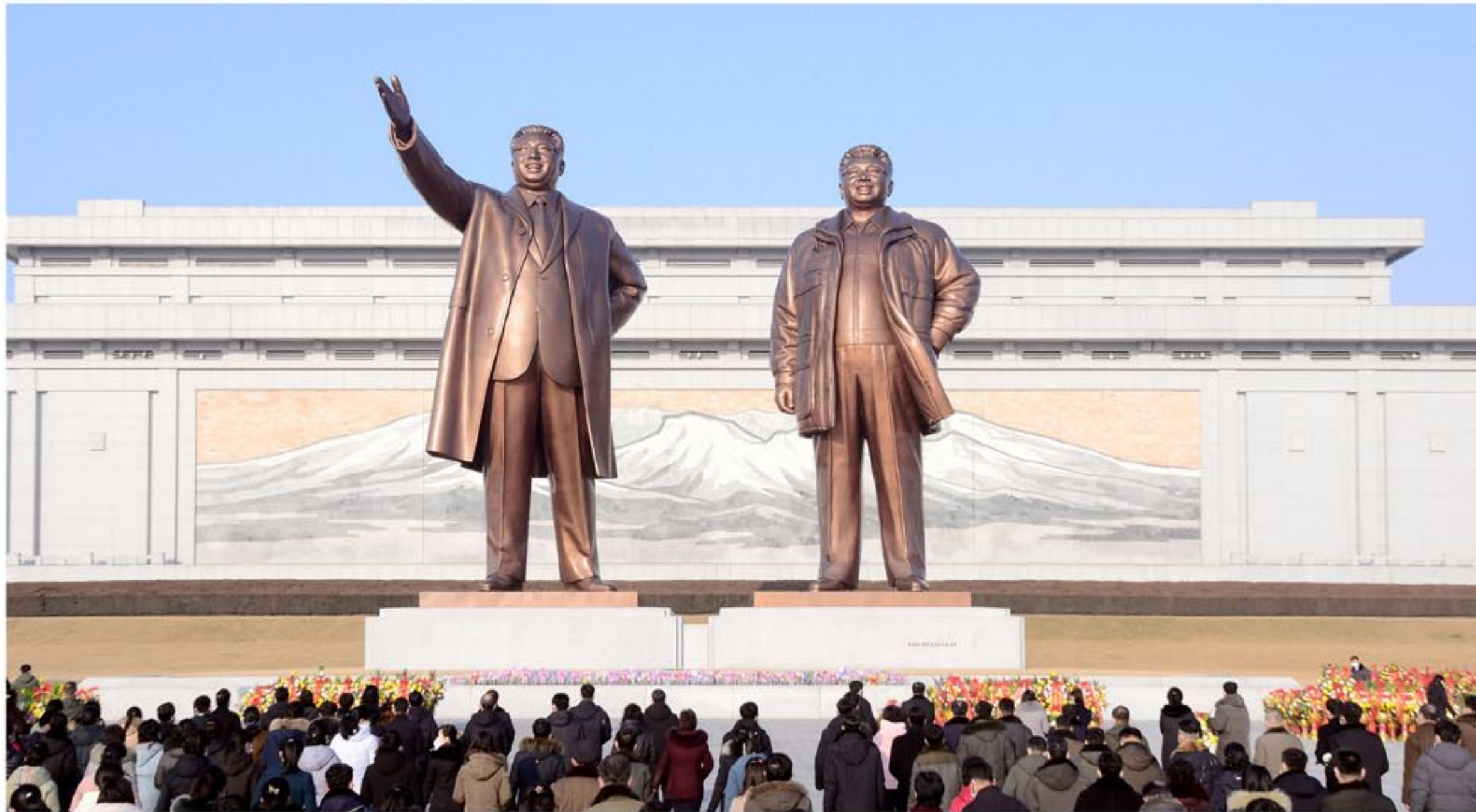
По случаю знаменательного Дня Звезды руководящие работники, трудящиеся и военнослужащие возложили корзины и букеты цветов к бронзовым статуям Ким Ир Сена и Ким Чен Ира на возвышенности Мансу.