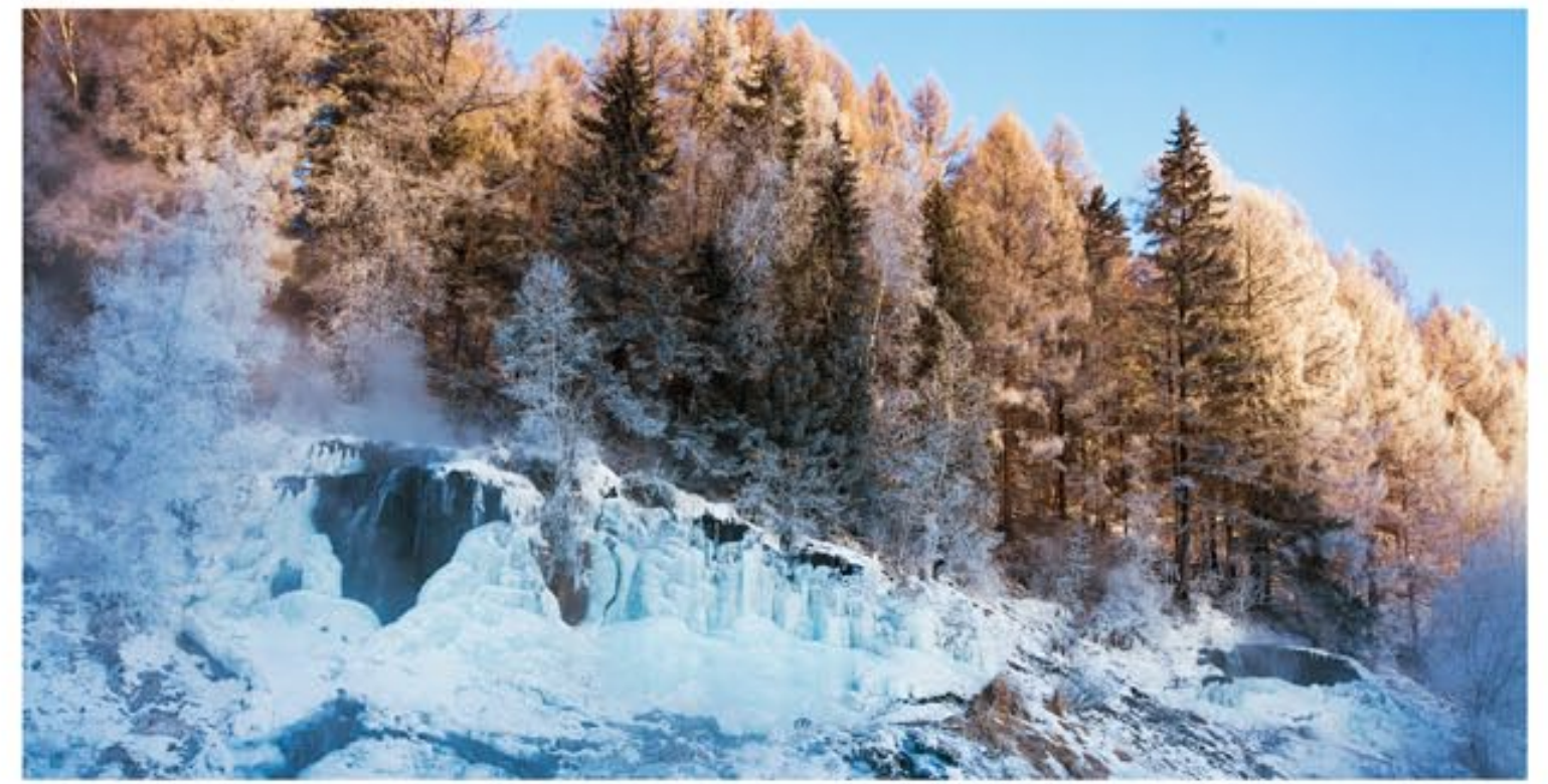
Водопад Ли Мён Су, который, можно сказать, представляет собой миниатюрную совокупность разнообразных водоскатов, отличается своеобразием посезонных пейзажей, гармонично вписываясь в такую окружающую природу, как черные скалы, обнаруженные между струйками, водоем с хрустальной водой под водопадом и роща и др.