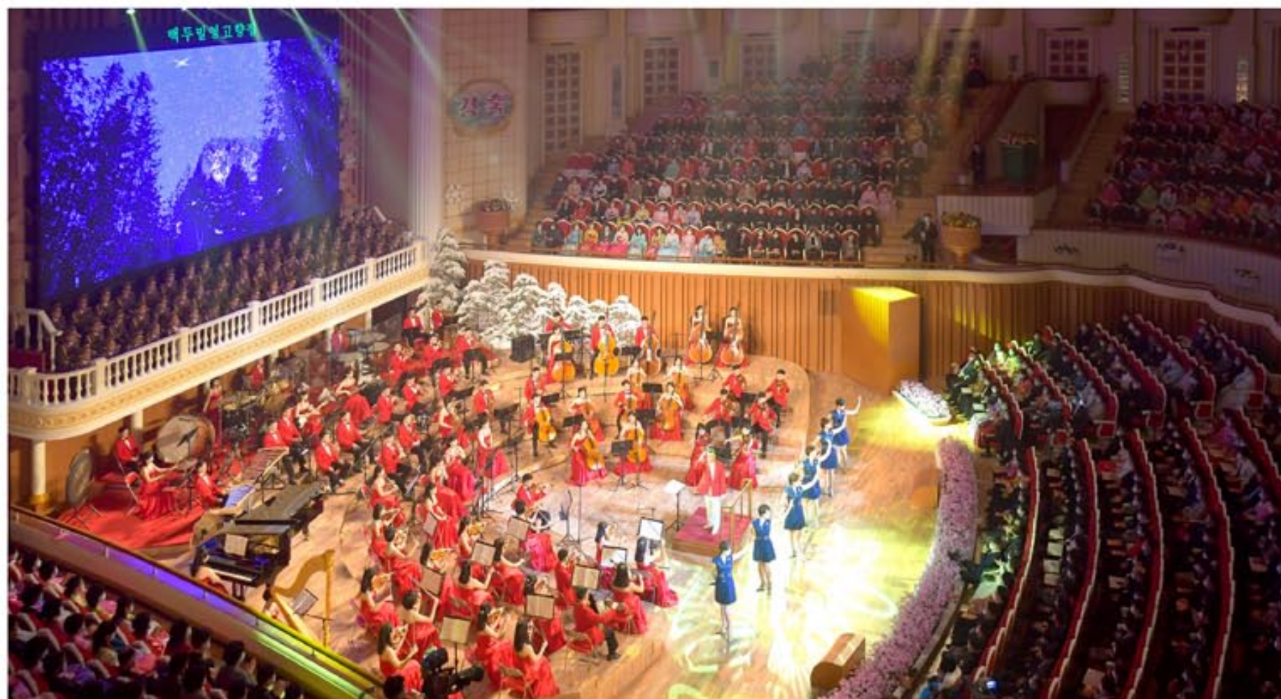
В театре «Самджиён» дан торжественный концерт в честь величайшего национального праздника – Дня Звезды.