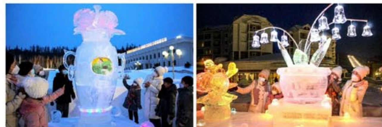
По случаю знаменитого февральского праздника в городе Самджиёне проходил показ снежно-ледяных скульптур.