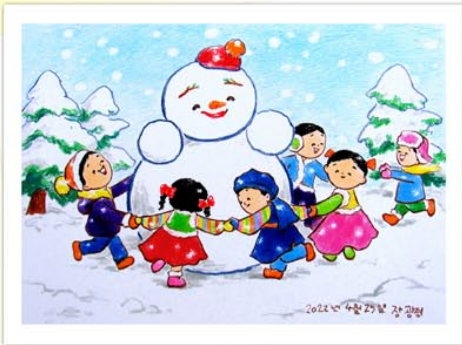
«Лепим снежную бабу» (Чан Гван Гён), первое место.