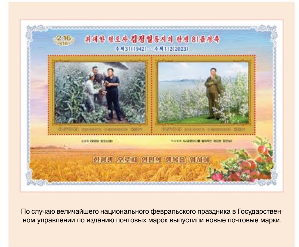
По случаю величайшего национального февральского праздника в Государственном управлении по изданию почтовых марок выпустили новые почтовые марки.