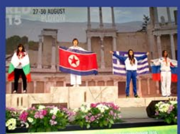
На 19-м чемпионате мира по тхэквондо. 2015 г.

На соревнованиях, проводившихся в стране, она как тяжеловес в полной мере показала свои способности, а на 9-м чемпионате мира по тхэквондо среди юниоров (2010 г.) заняла первое место по личному матсоги (поединку), коллективному тхыл (комбинации упражнений), коллективному матсоги и коллективному тхыги (мастерству) в весовой категории до 70 кг и получила 4 золотые медали. На 17-м чемпионате мира, состоявшемся в следующем