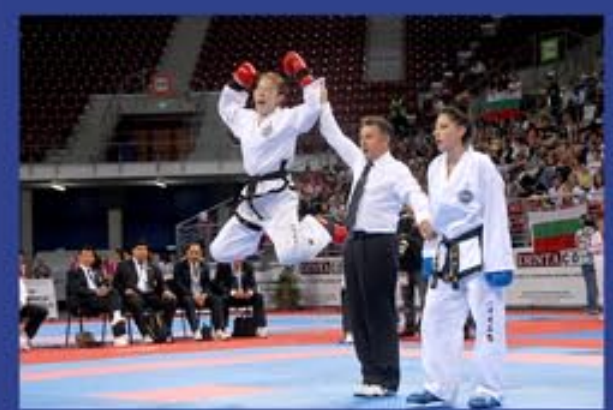
На 18-м чемпионате мира по тхэквондо. 2013 г.